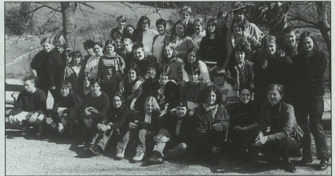
Talde honetatik Eskoriatzan sei aleman izan genituen.

Gainera, jende gehiago animatu da aurten eta guztiak ere oso gustora ibili zirela, argazkiek aski argi frogatzen dute.