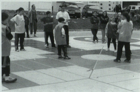
Umeak majo ibili ziren partxisien jokaldien. Eta hain ume ez zirenak gustora begira.

Horietaz gain jendearen gustoko beste ekintza mordo bat ere egon zen. Baina ez goaz gu hemen horiek aipatzera, banatu zituzten programetan agertzen baitziren, eta nahi izan zuenak parte hartu baitzuen. Ziur gaude jai hauetan disfrutatutak zutenek hurrengo urteko programa egitean arrakasta izan zuten ekintza horiek kontuan izango dituztela. Baina bada datorren urterako