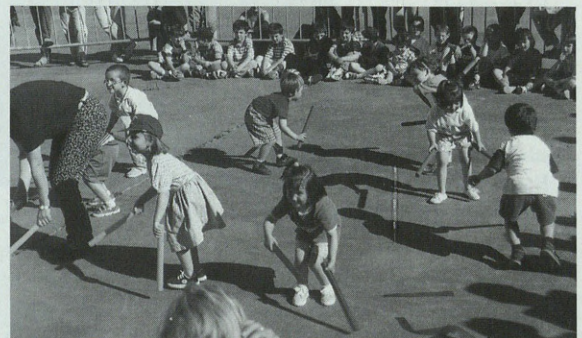
Rosa andereñoaren haurrak dantza baten.

irakasle eta ikasleek merixenda goxo-goxoa dastatzeko aukera izan zuten. Horrelako jaialdia antolteza ez al da oporrei hasiera emateko modu bikaina?.