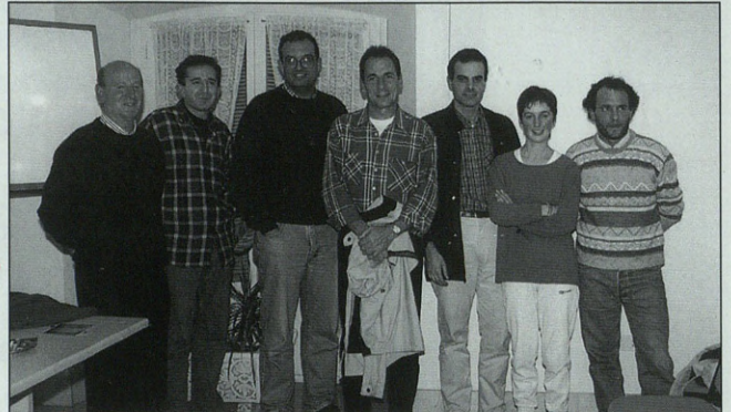
ATXORROTX ONG-ko zenbait kide.

Denda hauek, gainera, aukera polita eskaintzen dute Gobernu Kanpoko Erakundeek martxan dituzten proiektuak erakusgai jarri, eta bide batez, atxekimenduak lortzeko, kontzientziario lan garrantzitsua egiteaz batera.