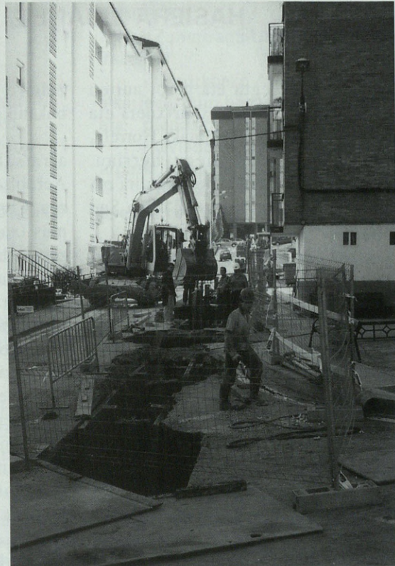
San Pedro auzuen egindako zangan tuberixak sartzen.

txura danak dauko, baina euki deigun pazientzia apur bat, Deba ibaia garbitzeko ahalegin honek merezi dau eta.