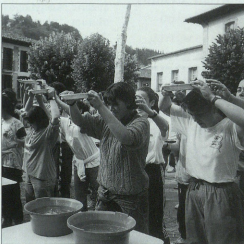
Aurten ez da kuadrilen arteko jokurik egongo.

Dena den jaien hasiera ofiziala Ekainaren 28an egingo da, San Pedro bizperan, orduan botako baita txupinazo. Aurten pregoia Museo Eskolaren eskutik etorri da.