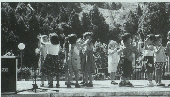
Luis Ezeiza ikastetxeko haurrak.