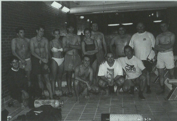
Lehen buzeo ikastaroko talde guztia.

Ikastaro honetan parte hartu duten lehen ausartak hilaren 17an hasi dira baina oraindik ez da berandu aurrerago antolatuko diren beste buzeo ikastaroetan izena emateko. Gainera, buzeo ikastaroan parte hartu duenak titulu bat eskuratu ahal du froga batzuk gaudituz gero.