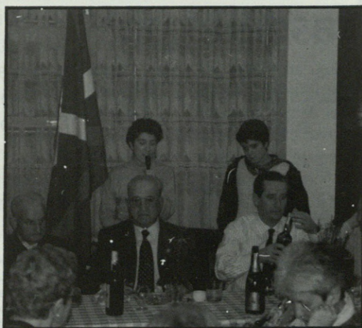
Bazkal orduan giro polita, bertsolari eta guzti.

Abesbatzarekin denek Agur jauna kantatu, amaiera eman zitzaion omenaldi honi.