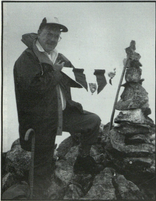
"El Leon" gailurrean, irailaren 26an.