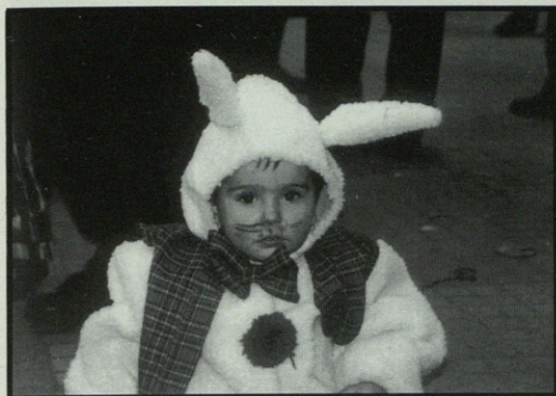
Umeek ere mozorrotzeko aukera izan zuten.