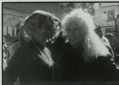
Aratusteetako neskarik politenak.