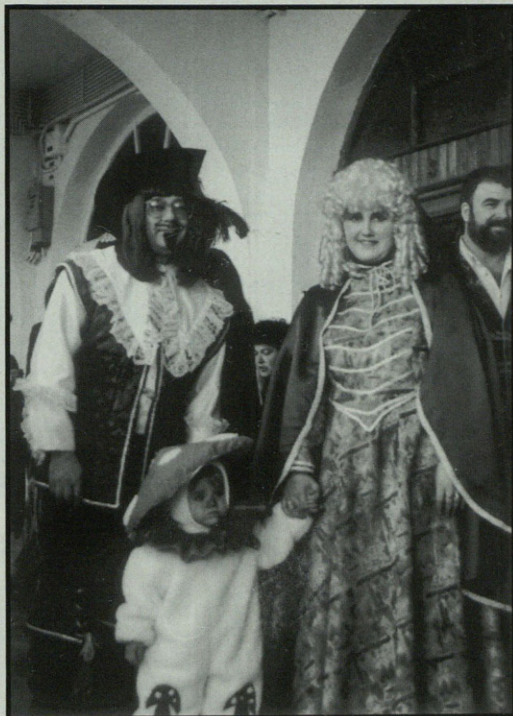
Dartañan, bere hiru mosketero barik ere, Atxabaltan izan genuen.