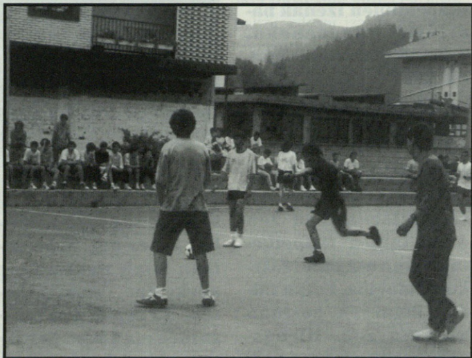
Egunero futbito partiduak jokatzeko dira Arlutz osteko kantxan

Arlutz futbito txapelketari dagokionez, hasi dira dagoeneko lehen neurketak eta talde batzutatik besteetara dauden diferentziak nabarmentzen hasi gara. Baina aurretik esan behar dugu guztira 25 taldek eman dutela izena. Talde guztiak hiru multzotan