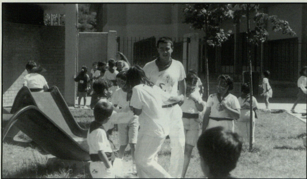
172 ume elkartu dira lehenengo hamabostaldian