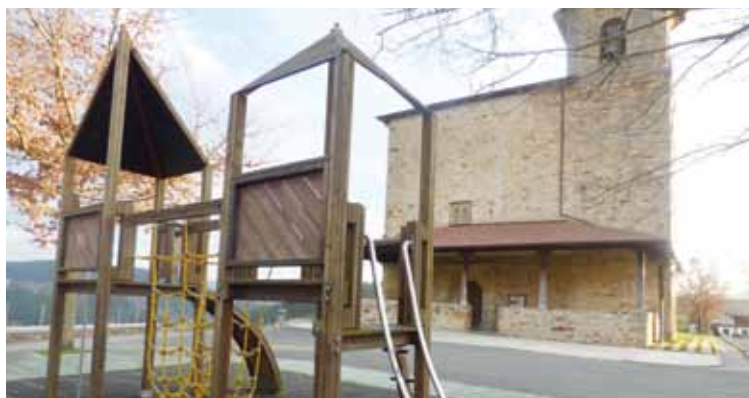
Apotzagako jolasparkea bertako elizaren aurrean dago.

Zerrenda esku artean, txosten juridikoa egingo du Eusko Jaurlaritzak. Elizak erregistrok legearen barruan egin dituen arren,