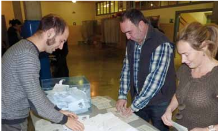
Botoak kontatzen domekan egindako herri galdeketa.