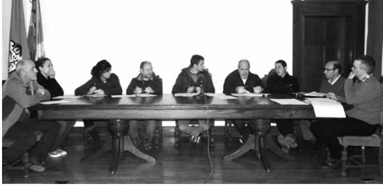
Udalbatza, martitzenean egindako osoko bilkuran | L.Z.

Martitzenean egin zuen udalbatzak urtarrileko osoko bilkura. Gipuzkoako errefusa Epeleko hondakindegira eroatearen inguruan zabaldu den aukerarekin lotuta, Elgetako EH Bilduk mozioa aurkeztu zuen eskatuz hondakindegia gaur egun ematen duen zerbitzua ematen jarraitzea eta "eskumena duten organoetan gaia sakon lantzea eta eztabaidatzea". Horrekin batera, Debagoieneko Mankomunitateari eskatu diote Epeleko Hondakindegia inguruan duen "informazio guztia partekatzeko". EH Bilduko zinegotzien babesarekin onartu zen mozioa. Gu Geu Elgetako ordezkariak abstenitu egin ziren. "Informazio gehiegirik ere ez daukagu (...) gauzak zertan diren jakiteko. Gainera, ez da oraindik Mankomunitateak proposamen zehatzik egin eta gauzak aurrerapen