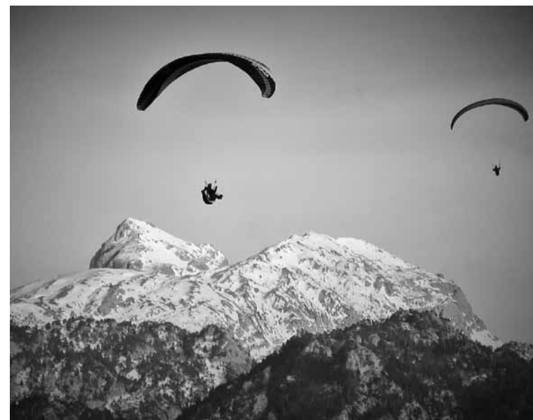
Hegan, zurututako tontorren gainean.