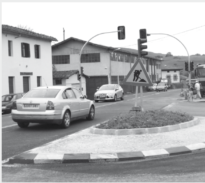
Olabarrieta eta Zubillaga lotuko lituzke herribusak. | O.E.

Herri barruko mugikortasunerako samurtasunak ematea da herribusak duen helburua. Erdigunetik urruti bizi diren horiek herrigunera gerturatzeko, baina baita alderantziz ere. Hiru proiektuetan geldituak eta ibilbideak zehaztuta daude. Aukera ezberdinen arteko diferentzia nabarmena da lantokietara joateko zerbitzua barne sartzen den edo ez. Otsailean du bilera Udalak ULMA taldeko ordezkariekin, eta gaiaz berba egingo dute. Aurreko bilera batean, elkarlanerako jarrera ona ikusi dute udal ordezkariak.