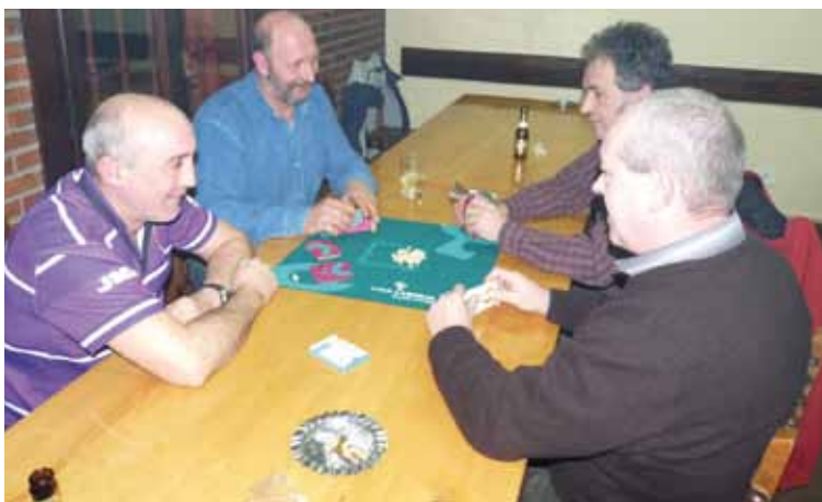
Mus txapelketak harrera ona izan ohi du; irudian, 2013ko jaietakoa.

11:30 Lore Gazteak taldearen dantza emanaldia.