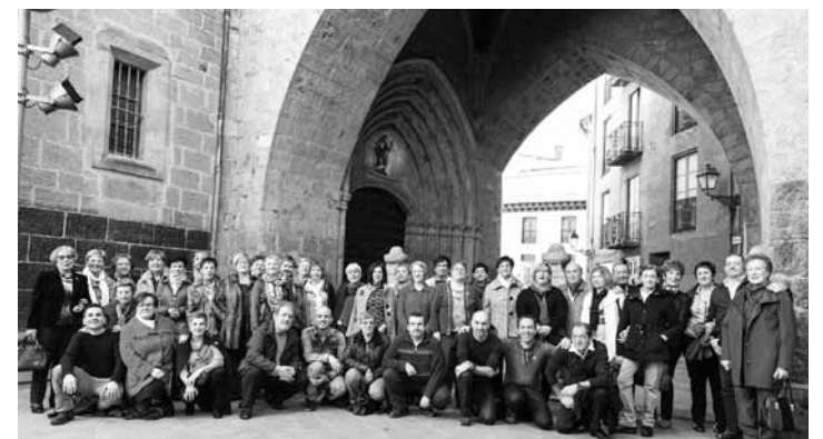
Iazko ospakizunean ateratako talde argazkia. | ANTONIO MURILLO

200 oñatiar inguru bizi dira Arrasaten, eta, azken urteetako ohiturari eutsiz, aurten ere elkartuko dira. Martxoaren 5erako egin dute hitzordua; Ederra tabernan elkartuko dira, 13:30ean, eta 14:00etan talde argazkia aterako dute Herriko Plazan. Bazkaria Aldape (Batzokia) jatetxean egingo dute, 14:30ean, eta gero, DJ batek girotuko du bazkalostea. "Parte hartu gura duenak eman dezala izena lehenbailehen", adierazi dute. Interesatuak Ederra tabernan eman beharko dute izena.