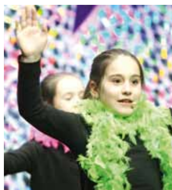
Luma dotoreak lepotik behera.