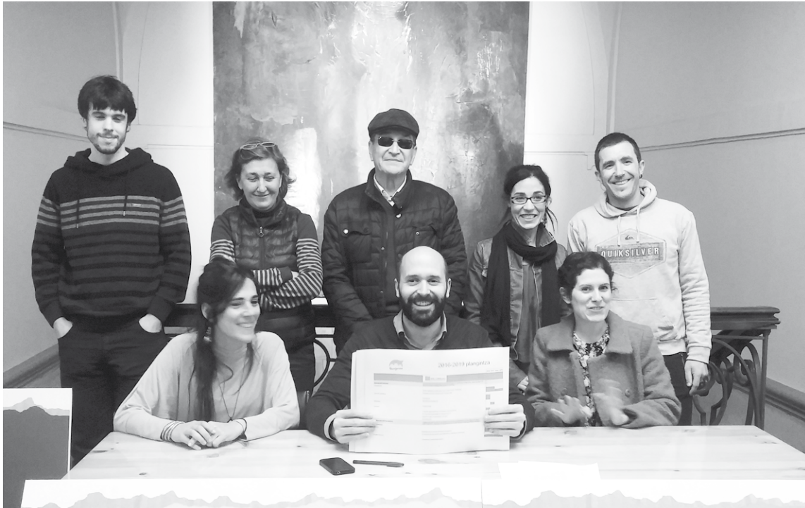
Eguazten iluntzean egindako prentsaurrekoa.