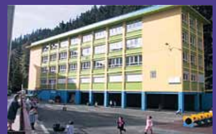
BEDOÑABE • Tel.: 943 79 20 69

Guk bezala, egin apustu, egin kiñu Euskal Eskola Publikoaren alde!