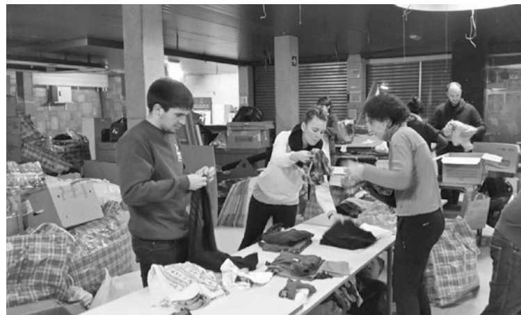
Batutako materiala antolatzen. | HOTZ BERGARA

tutako materialaren bidalketa ordaintzeko da. Hain justu ere, egun hauetan ari dira mantak, kanpin dendak eta lo zakuak Siriara bidaltzen, Siriako Herriarekiko Laguntza Elkartearen (AAPS) bitartez. Materiala sailkatzea eta bidaltzea da orain lehentasuna –kaxak eta boluntarioak behar dituzte–, eta jaso ez dute gehiago egingo oraingoz.