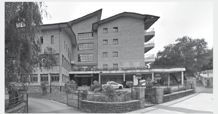
San Martin egoitzaren ondoan eraikiko dituzte. | O.E.