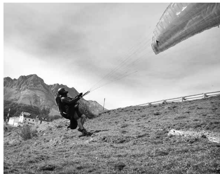
Hegaldia hasteko unean.

Oianguren: Hegan egiteko ezinbestekoak dira parapentea bera eta jarlekua. Hortik aurrera, oso gomendagarria da larrialdietako paraxuta ere aldean eramatea, kaskoa, neguan arropa gehiago hartzea, mendiko botak, GPSa, irratia, ura, nahi bada argazki kamera... Baina poliki-poliki bagoaz pisua hartzen.