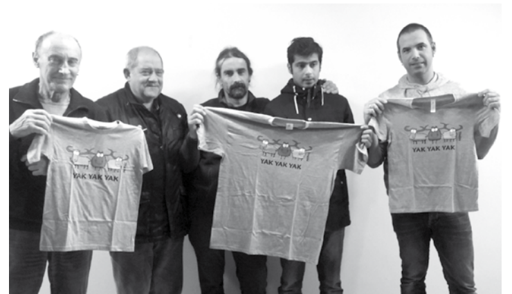
Nepal laguntzaileak eguazteneko prentsaurrekoan. | M.B.

Nepalerako dirua biltzen jarraituko dute