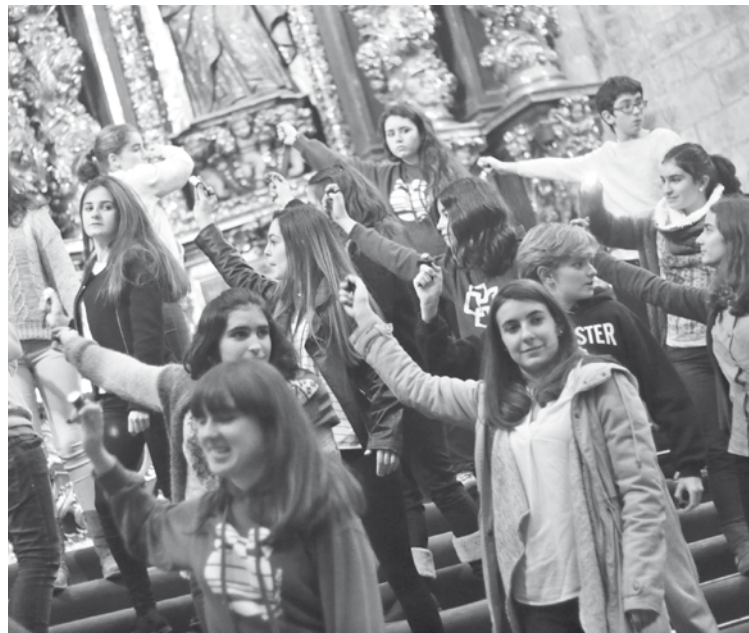
Ganbara txikikoak entseguan, domekan.

Sarrerak hamar eurotan daude salgai Txokolatexan eta www.ganbara.sacatuentrada.es webgunean.