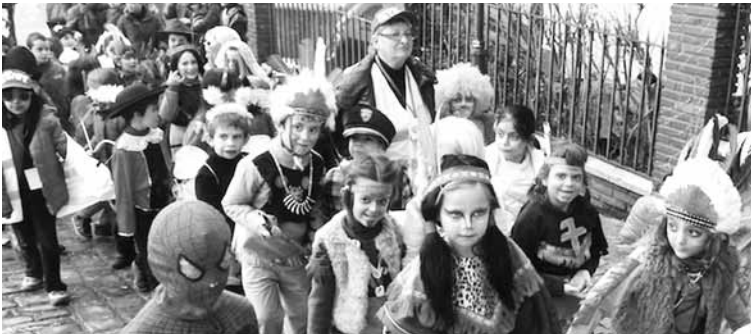
Herri Eskolako neska-mutikoen moztorro kalejira, iaz. | L.Z.

Otsailaren 3an San Blas opilak egingo dituzte eskolan 5 urteko gelatik gorako umeek. Eta otsailaren 4an Santa Ageda bezperako koplak abestera irtengo dira Lehen Hezkuntzako neska-mutikoak, 15:00etan. Plazan elkartuko dira Haur Hezkuntzakoekin batera azken koplak abesteko, 15:45ean.