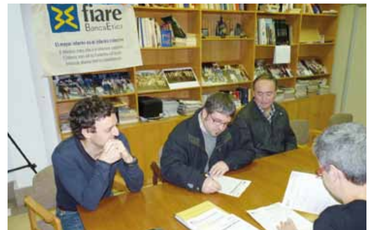
Parrokiako ordezkariak Fiare bankuko langilearekin eguaztenean.

Elkartek ez ezik norbana-koak ere egin daitezke bazkide, Internet bidez, eta horretara animatu ditu Etxebarriak: "Gizarte berri baterako aukera bat da Fiare eta gardentasun osoz egiten du lan".