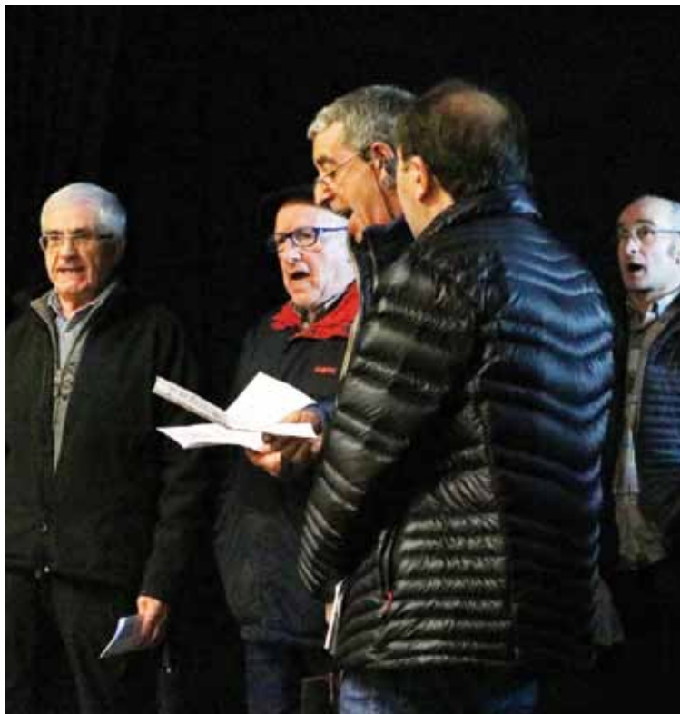
Santa eskean irteteko egin zuten lehenengo entsegua.

Iluntzean erretiratuen elkarrean egingo dute afaria, egunean zehar jasotako jeneroarekin.