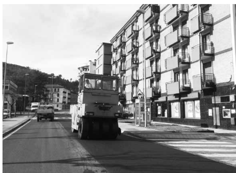
Gipuzkoa etorbideko asfaltatze lanak, eguzten eguerdian. | JOKIN BEREZIARTUA