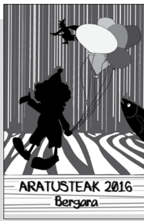
Aratusteetako kartela.