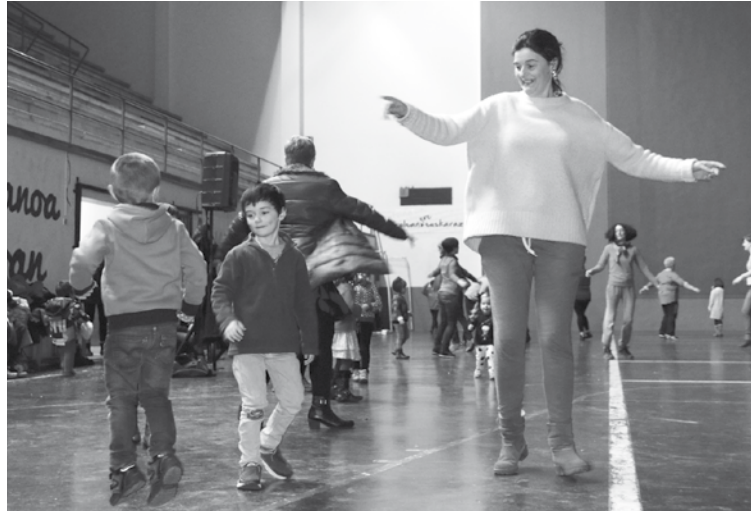
Urdelardero egunerako dantzak entseatzeko.

Zapatuan, otsailaren 6an, mozorroen eguna izango da, eta 13:30ean desfilea izango da herrian zehar. Hain zuzen ere,