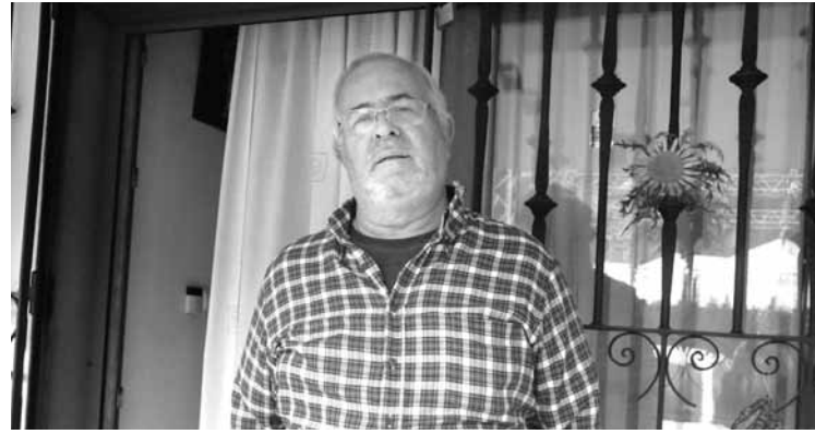
Arrasaten bizi bada ere, gorliztarra da Bedialauneta. | LEIRE KORTABARRIA

Mundutik Arrasatera egitasmoaren hurrengo ipuin kontaketa martxoan egingo dute. Orduan, Nepalgo istorioak kontatuko dituzte. Ikasturtea bukatzeko, berriz, azken saioa maiztzean egingo dute, eta Pakistango ipuinak izango dira protagonista.