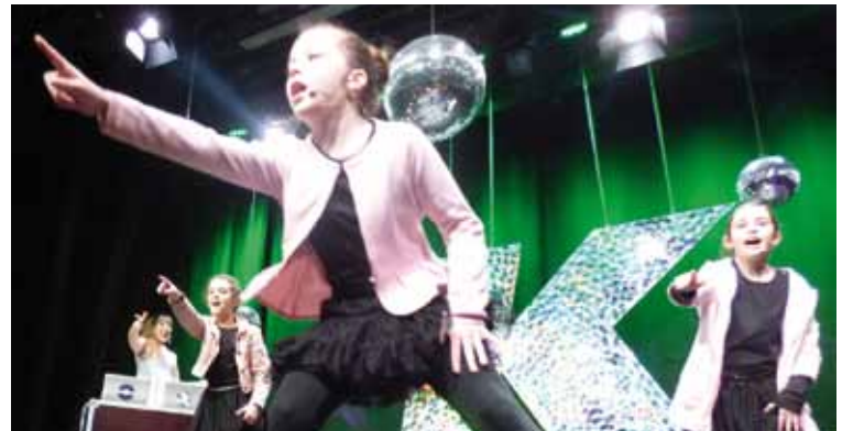
Ondo entseatutako koreografiekin dantzan.