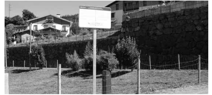
Txakurrak solte eramateko hiru guneetako bat, ospitale atzean.

2003an, 2006an eta 2007an, alarmak piztu ziren urteetan, jarraipen zehatza egin genuen gure kabuz eta neurriak ere hartu genituen bere garaian. Gaur egun ere egiten dugu jarraipena eta urte amaieran txostena aurkezten dugu Udaleko Ingurumen batzordean. Orain, baina, ez dago larritzeko arrazoirik. Astelehenean bertan jaso genituen 2015eko datu guztiak, eta Arrasateko airearen kalitatea ona da. Hori bai, gai hauetan ez dago erlaxatzerik, kontrolerako baliabideak mantendu egin behar dira.