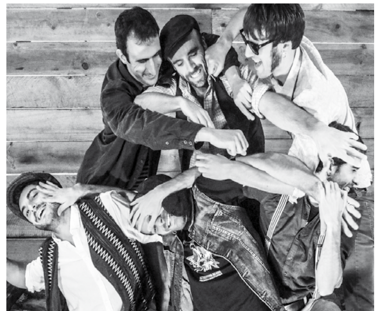
McOnak taldea izango da datorren astean. | MCONAK

Bigarren astean, otsailaren 11n, Italiatik etorriko da talde gonbidatua. Small Jackets izango dira, hard rock eta rock-and-roll estiloak jorratzen dituen laukotea,