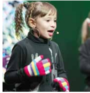
Neskatoa gogotsu kantuan.

Bertaratu zirenen aurpegietan ere irribarre zabalak izan ziren nagusi. Mugikorreko kamerekin une guztiak hartu nahi izan zituzten eta txalo zaparradak etengabeak izan ziren. Kantari festa hasi besterik ez da egin!