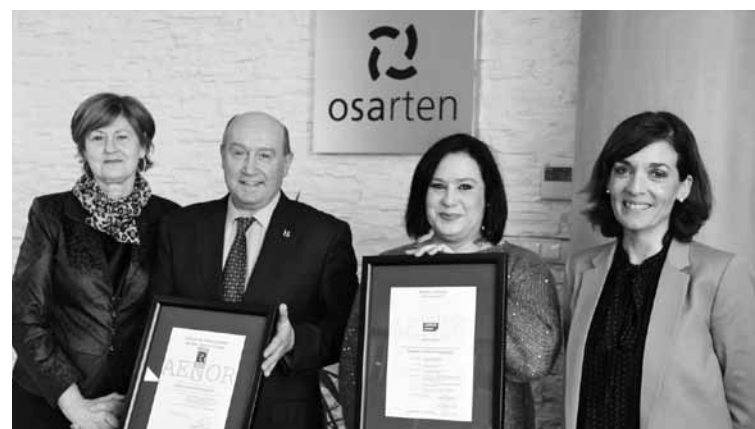
Enparantza, Lafuente, Iruretagoiena eta Serrano. | MONDRAGON

"Ekonomia solidarioan, erronka energetiko-ambientalak ere baditugu"