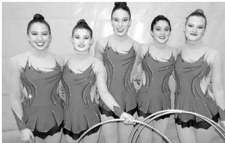
Azkoitian lehiatuko den taldeetako bat: gazte mailako arrasatearrak. | DRAGOI