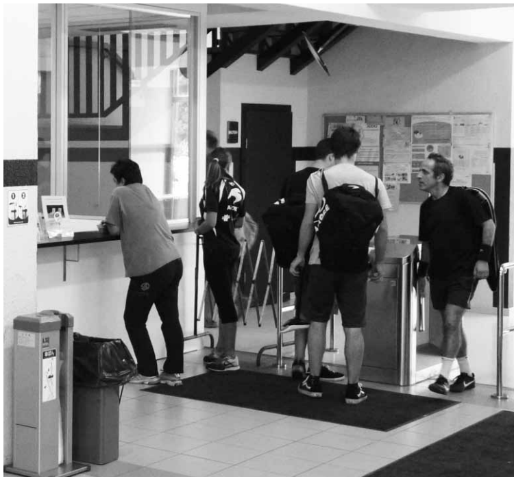
Musakolako kiroldegiko sarrera, artxiboko argazki baten.

Kuota bera arrasatearrentzat Udalak aditzera eman duenez, Debagoieneko Kirol Txartela kendu dute zenbait herritan abonua