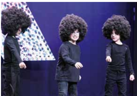
Kantuan eta dantzan egiteko itxura aldatuta.