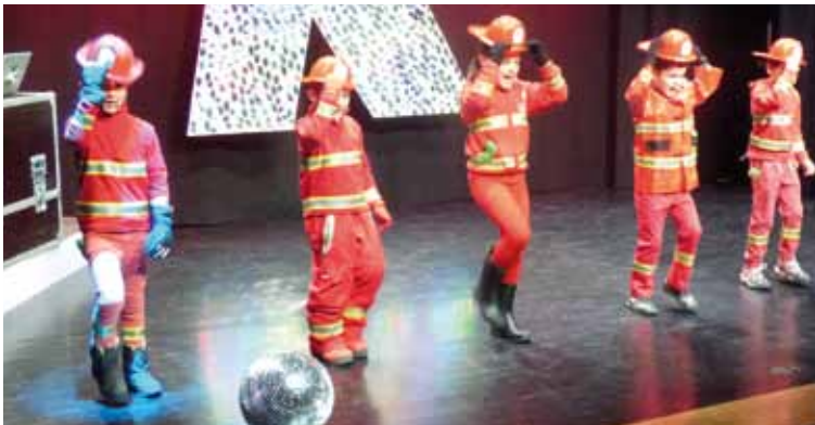
Suhiltzaileak kaskoak jasota kantuan.