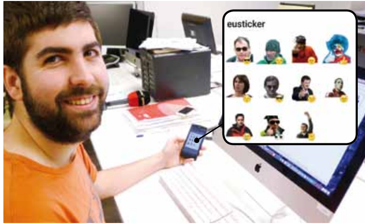
Lizarazu, eusticker -en egilea. | MAIDER ARREGI

Googlen bilatutako argazkiak dira. Pertsonaia ezberdinen emozioak aurkezten dituzten irudiak hartzen saiatu naiz ondoren emotikonoekin lotzeko. Porrotx pozik,