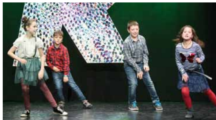
Aretxabaletako neska-mutiko kuadrilla oholza gaanean.