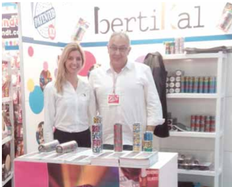
Bertikaleko ordezkariek Nurenbergeko jostailu azokan, eguaztenean. | BERTIKAL

Aurretik ere egon izan dira beste azoka batzuetan; Kordoba-koan eta Bartzelonako Ibertoyan, esaterako: "Arrakasta izan zuen gure jostailuak azken horretan, eta sektoreko batek baino gehiagok harrituta esan zigun nolatan ez duen saririk jaso oraindik, hain berritzailea izanda".