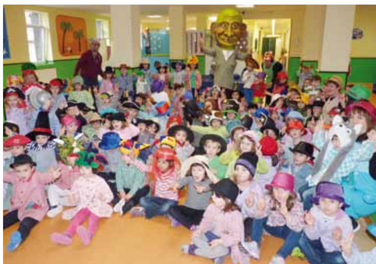
Basabeazpiko neska-mutikoak Txapel Txinekin pozik. | M.A.