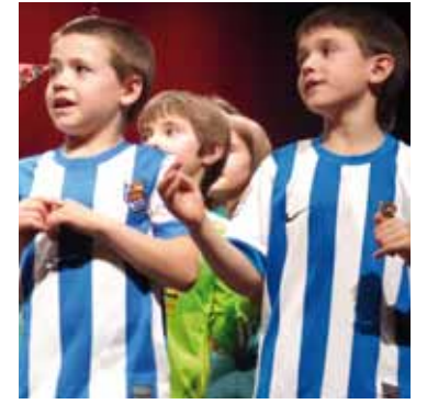
Realeko kamisetak aldean.