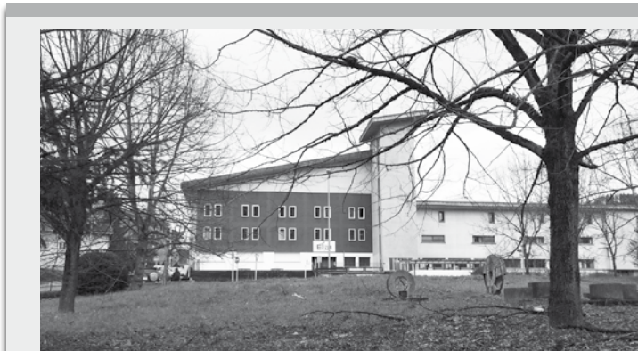
Eraikinaren aurrean dagoen belargunea. | O.E.

Alderdi jeltzaleak egindako ekarpenak ere aurrekontuen txostenean jaso ditu EH Bilduk, oposizioak proposatutakoari erantzuna emanda. Ekarpenteko batzuk ondo ikusi ditu Udal Gobernuak eta horiek gauzatzeko diru partida