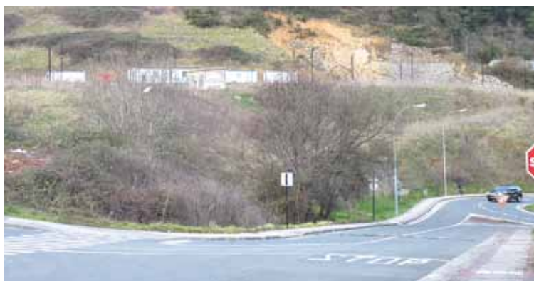
Obretan erabiliko dituzten etxetxoak jarrita daude.

Gaur egun erdigunean dagoen Bergarako Lanbide Heziketako zentroa Candyren ondora pasako da