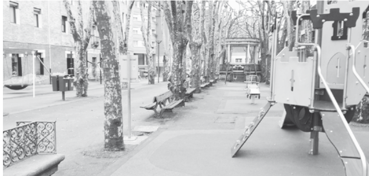
Espoloiko jolas parkea. | JULEN IRIONDO

Bestalde, Sañudo-Lasagabaster familiak Udal Artxiborako egindako Lasagabaster enpresako artxiboaren dohaintza ere