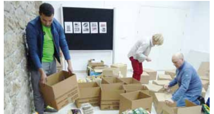
Astelehen arratsaldean bildu zituzten elikagaiak kaxatan. | MAIDER ARREGI

Baina aurten laguntza ekonomikoa ere eskatu dute Saharako bidaltzeko: "Urriko uholdeek dena suntsituta utzi dute. Aurten premiazko laguntzaren beharra dute, eta dirua batzen gabilta. Diruz lagundu gura duenak banketxeetan ditu kontu korrontek zabalik".