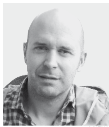
"Aurrekontu orekatuak onartu ditugu 2016rako"

2015 itxieran zorpetze maila bi milioi ingurukoa izan da; azken hamarkadetako baxuena.