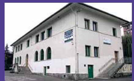
MUSAKOLA • Tel.: 943 79 04 49