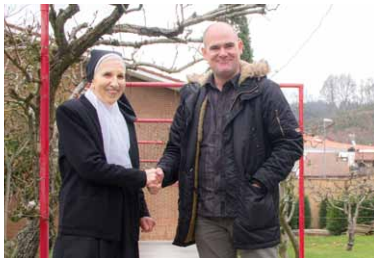
Aginagalde eta Elkoro komentuar duen lorategian, eguenean.

Agustindarrendako ez zen samurra izan Aretxabaletatik Errenteriarra joateko erabakia hartzea. Eta bizitzaren urte erdiak baino gehiago Aretxabaletan pasatu ondoren, nekez ahaztuko dituzte bertan bizitakoak. Orain, "pozik" doaz, ondarea herriari utzita.