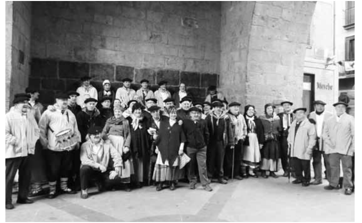
Parrokian elkartuko dira, goizeko zortzietan.

Amaitzeko, hobariak mantenduko dira ikasle arrasatearrendako eta diru sarrera baxuak dituzten herritarrendako; horiek bete beharreko baldintzen berri jasotzeko, kiroldegiko harreraren galdetu edo 943 77 16 77 telefono zenbakira deitu.