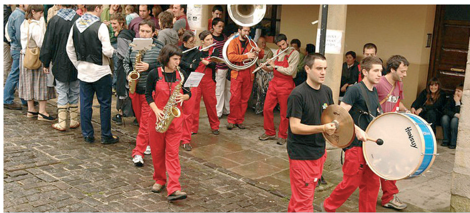
MUSIKA EZ DA FALTAKO ELGETAKO KALEETAN.