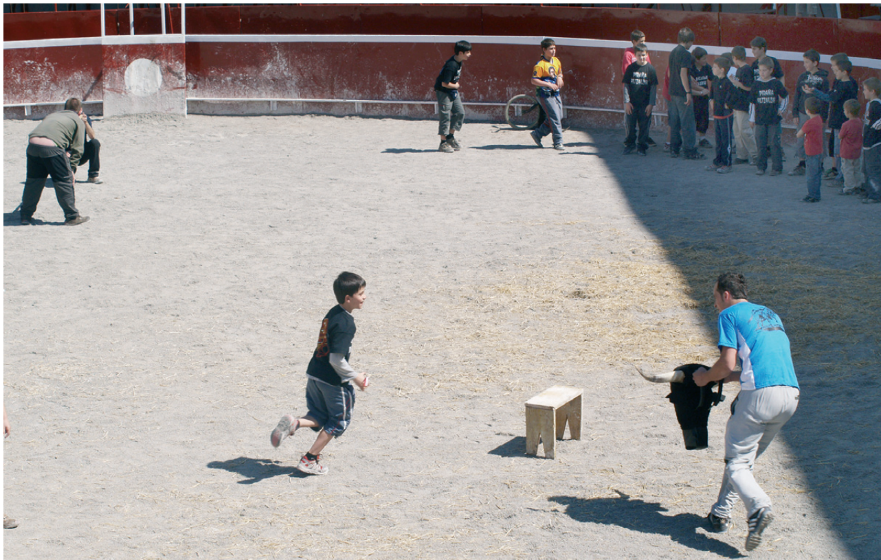
Errekortadoreen eskola poliki-poliki gure artean lekua izaten ari den ikuskizuna da.