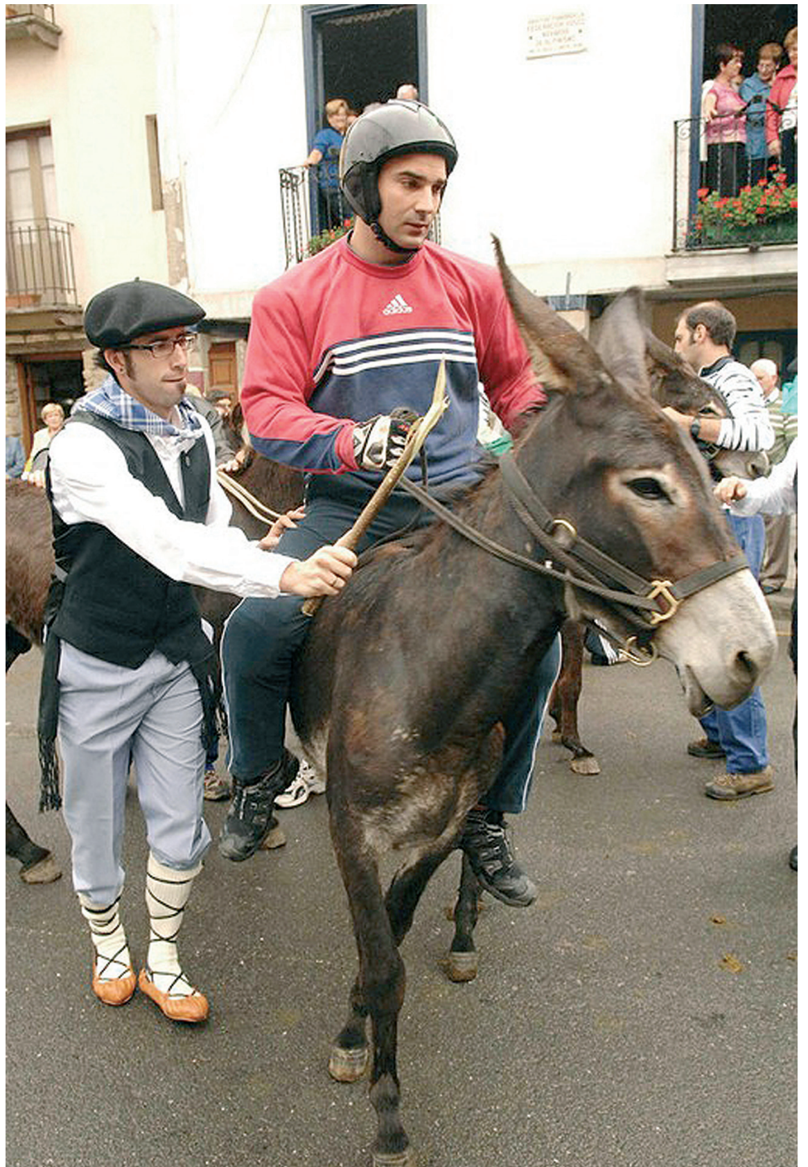
Asto lasterketa zapatuan, uztailaren 4an, egingo dute.

Iazko erantzun ona ikusirik, aurten ere zapatuan baserritar janzteko dei egin du Udalak. "Herritarrek ondo-ondo pasa dezatela eta egitarauaz aparte jaiak norberak egiten dituela ere esan gura diegu" adierazi digu Oxel Erostarbe alkateak.