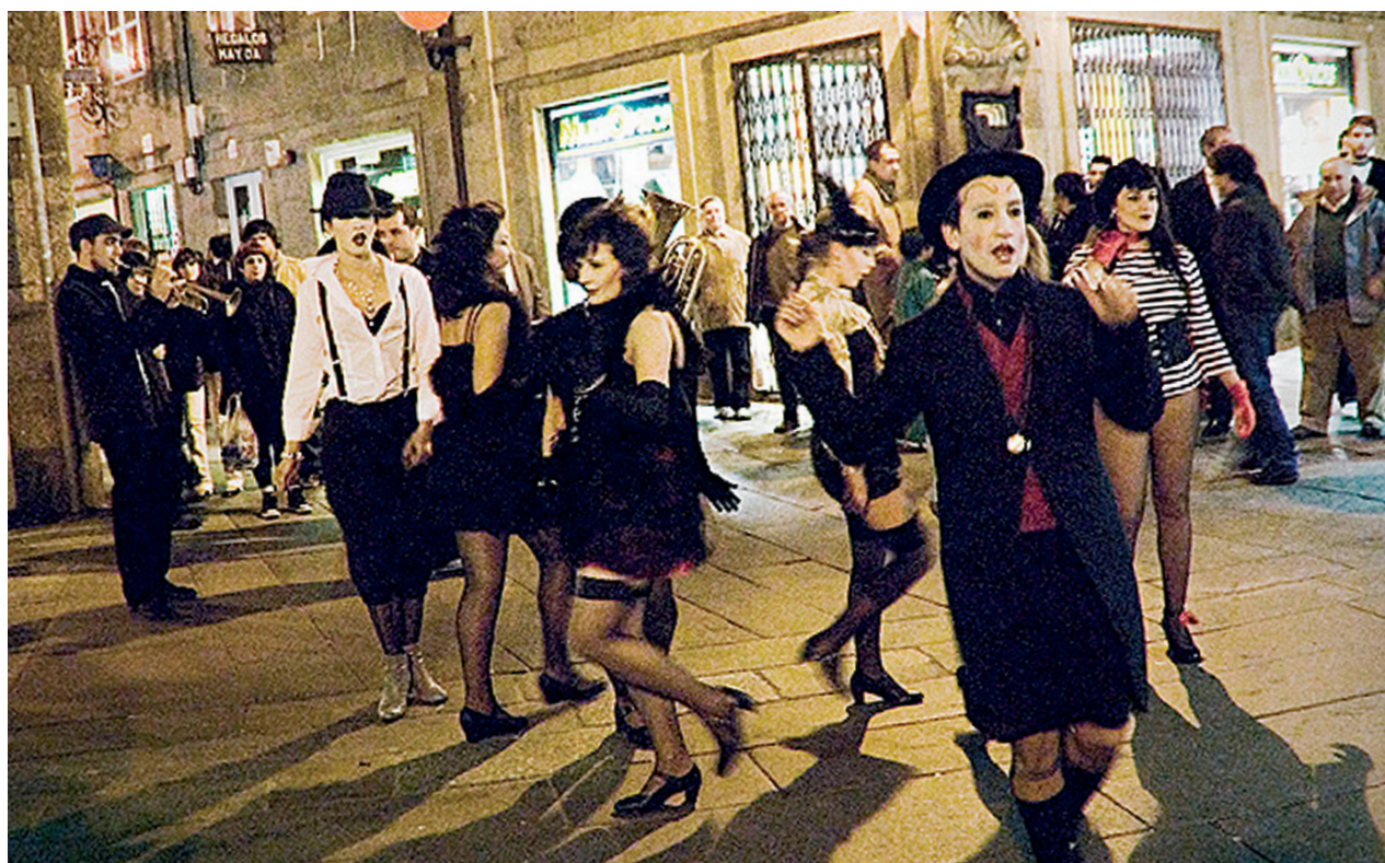
Femme Fatale taldearen Cabaredeambulante ikusteko aukera izango da domekan, uztailaren 5ean.

St James Street Band taldeak jarriko du musika, aktoreek euren lana bete-