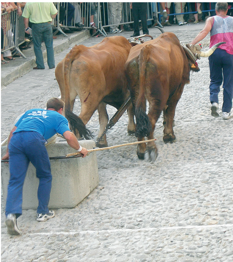
Idiek izango dute protagonismoa domekan ospatuko den azokan.

Elgetako, Zumarragako eta Bizkaiko idi pare gazteak lehiatuko dira probetan