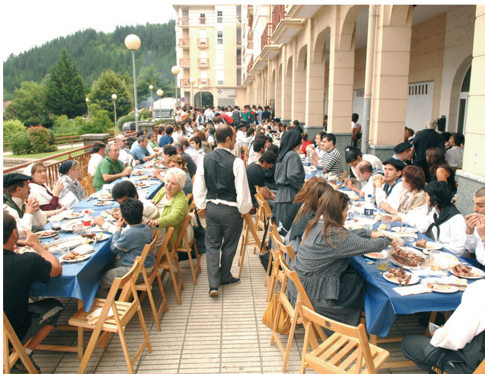
HERRI BAZKARIA EGUAZTENEAN EGINGO DUTE.