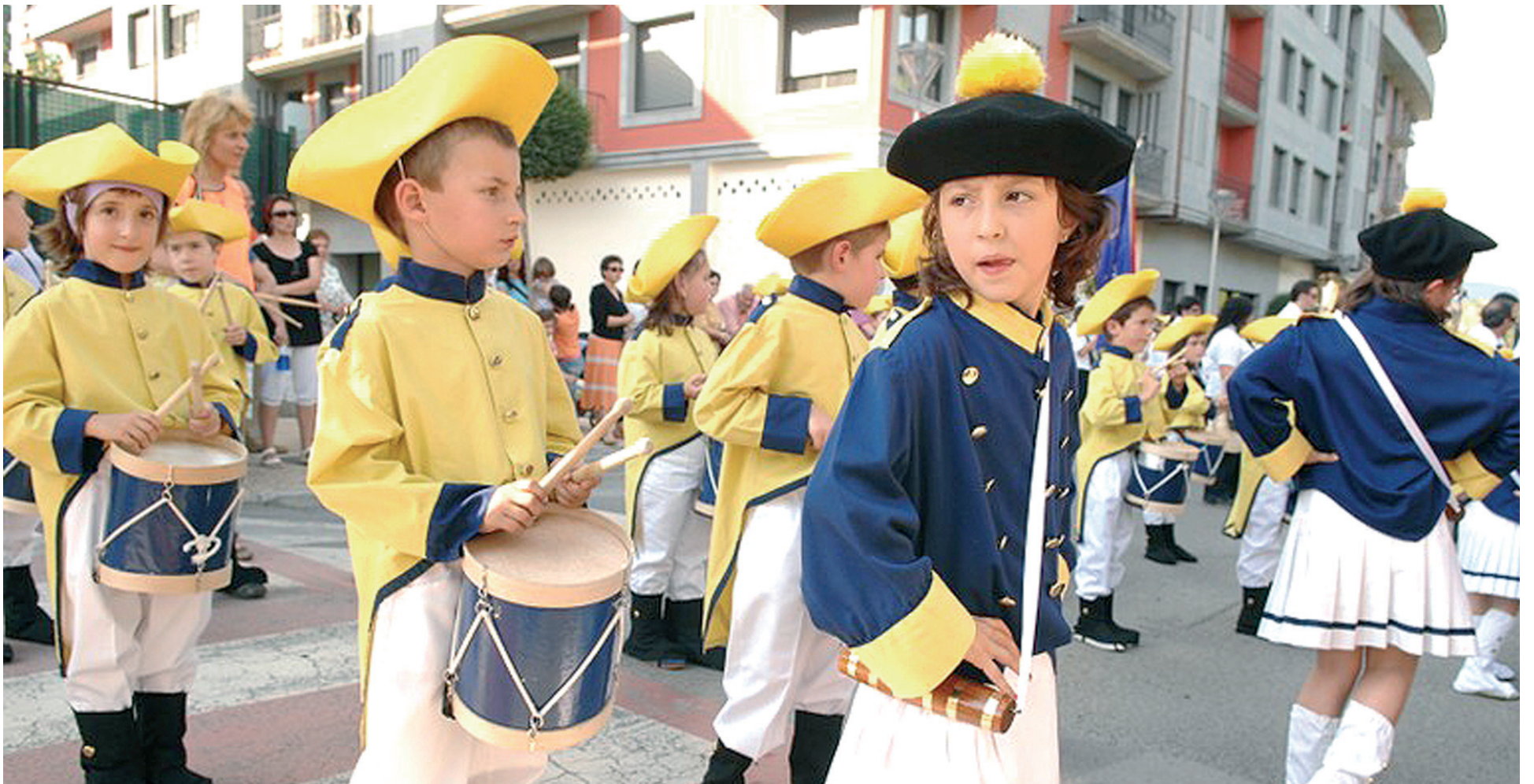
San Pedro bezperan eta Umeen Egunean danbor hotsak izango dira nagusi herriko kaleetan zehar..

Egubakoitza / 2009ko ekainaren 26a / GOIENKARIAren GEHIGARRIA