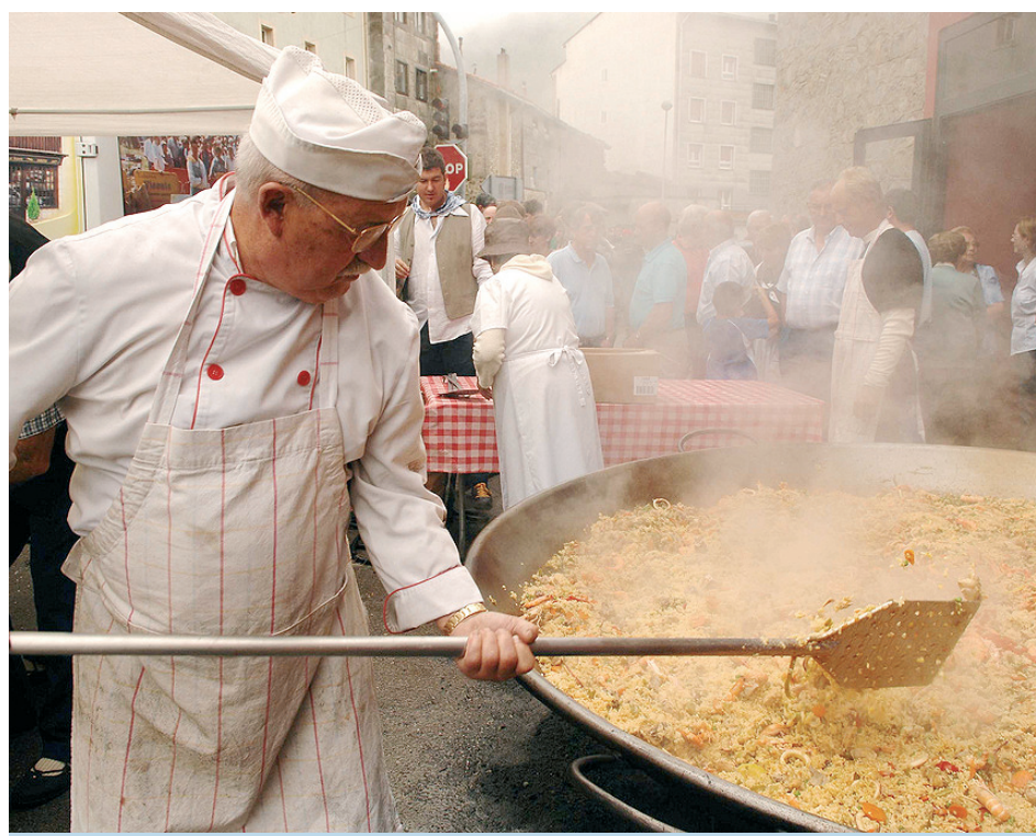
PAELLA ERRALDOIA GERTATUKO DUTE UZTAILAREN 4AN.