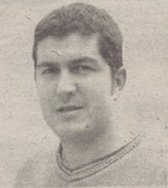
"Belaunaldi artian hartu-emona egotia garrantzitsua da"

Gure herriko Gaztetxeko batzarkidien kartia irakurtzia besterik ez dago azkenengo Goibekokalen.: "Asentzio eguna antolatzeak Gaztetxeari dagozkion beste ekintza batzuetan pentsatzeko denborarik ez digu uzten"... Eta