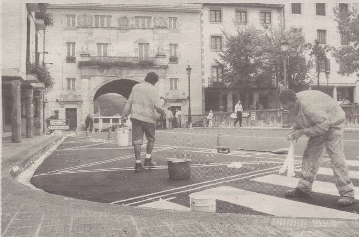
Bidea eta zebra bideak margotuta, bukatu dituzte errepideak egokitzeko lanak

Diputazioko teknikariak eta Udalak, autoek herritik igarotzean daramaten abiadura jaisteko neu-