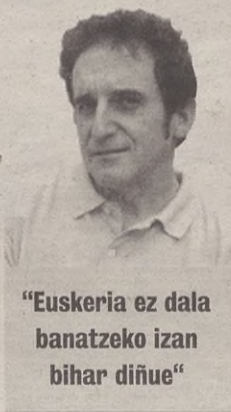
"Euskeria ez dala banatzeko izan bihar diñue"

Bada, hau herrixau Mendabia da, eta aurreko domekan, aldamenian dagoen Lodosara 125.000 "baskó" arrimatu giñan Nafarroa Oiñez zala eta ez zala. Bertako batzuk bazeuken kezka apurren bat, horrenbeste "baskó"kin gauza onik ez zala izango eta. Beste batzuk pozik ziran, piparrak sendo salduko zittuela, eta