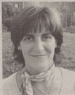
TERE DESKARGA 33 urte

Herri txikixetan politikuak alkarrekin ez egotia lanerako prest dagon jendia atzera bota leike. Proiektu abertzalia eruan bihar leukie batera.