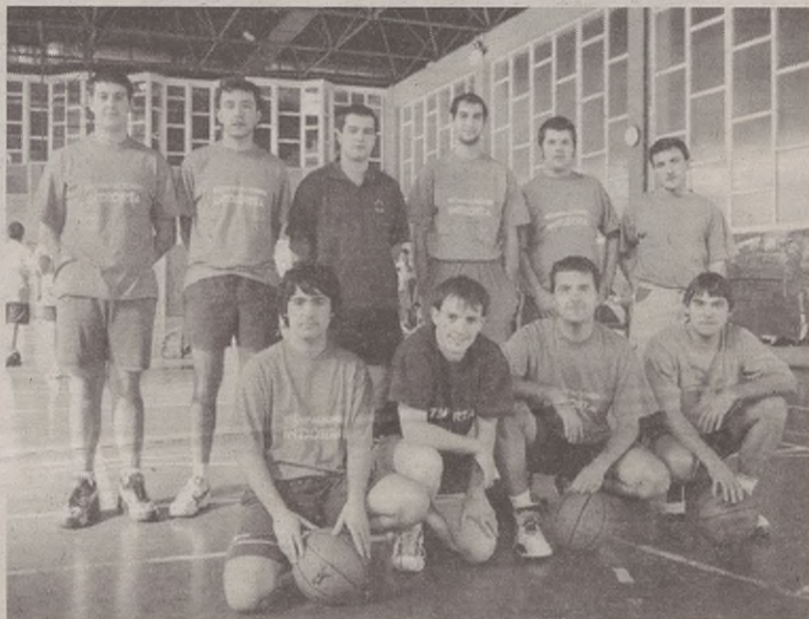
Txapelketa irabazteko faboritoak dira Estampaciones Intxortakoak

Estampaciones Intxorta saskibalo taldeak, domekan hasi zuen aurtengo denboraldia. Iaz liga eta kopa irabazi eta gero, txapelketa irabazteko faboritoen artean dago. Lehenengo partidari, 89 eta 19 irabazi zion txapelketako talde gazteenetakoari.