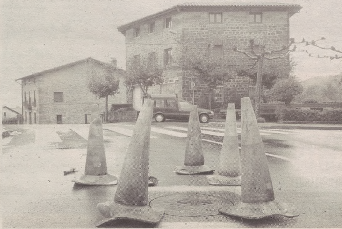
Begararik zetozen gidariak oso metro gutxi arte ezin zituzten konoak ikusi; ezin ukatu istripuak gertatzeko arriskua zegoela.

direla-eta, eguaztenetik itxita dago Bergarako bariantea eta Elgetara doan GI- 2632 errepidea lotzen dituen errepide zatia. Uberako zubibidea egiteko, derrigorrezkoa da errepide zati hau moztea.