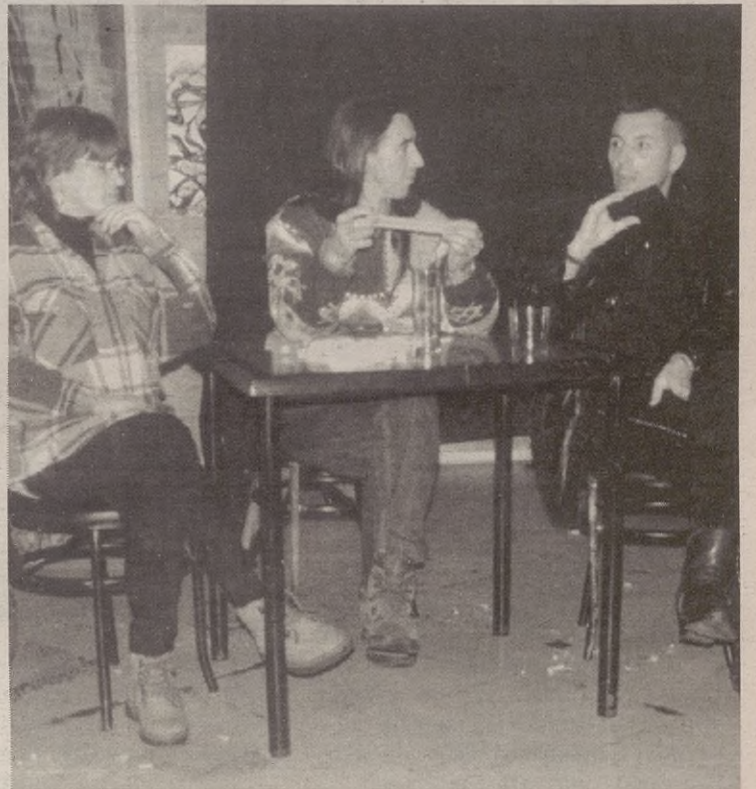
Hiesaren inguruan eztabaidatzeko aukera izango da asteburuan Gaztetxean.

Abenduaren 6an hasiko da defentsa pertsonaleko ikastaroa. Parte hartu nahi dutenek liburategian edo Gaztetxean dute izena emateko aukera. Argibideak 943 78 90 43 telefono zenbakian jaso daitezke.