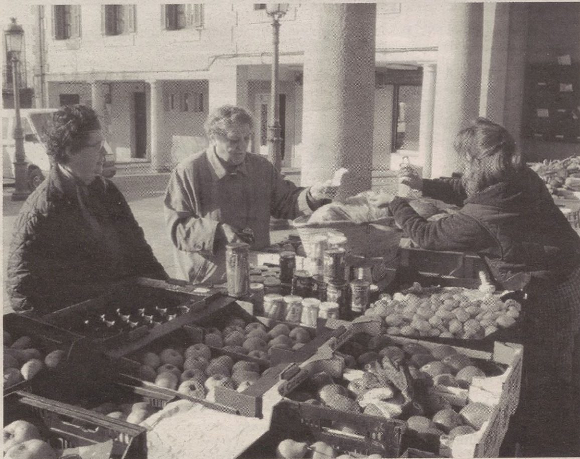
Frantziako euroak Elgetaraino heldu diren arren, pezeta erabili ziren batez ere astelehenetako merkatuan.

Tabernetan esan digutenez, kalera betaurrekoekin irteten hasi omen da jendea. Bistan arazoak dituztenek, ezin dituzte txan-