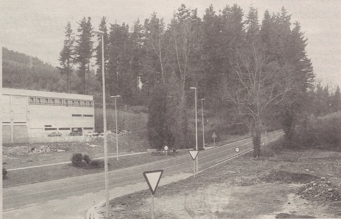
Pagatzako industrialdearen jarraipena Lehenengo Errekaraino helduko da.

Pagatzako industrialdeak 90.000 metro koadroko azalera dauka, eta 20 enpresa inguru dauka. Guztira, gutxi gorabehera, 400 lagun inguruk daukate lan finkoa.