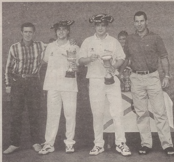
Aurten ere emaitza onak lortzea espero dute Ozkarbiko pilotariak.

Kirol teknikariak zirriborro bat gertatuta daukan arren, Udalean ondo aztertu nahi dute, Ozkarbi pilota elkartekoekin akordio batera iritsi nahi dute eta.