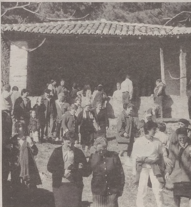
Beste urteetan ere jende ugari batu izan da San Blaseko baselizaren inguruan.

Aurtengoan ere, batuko duten dirua, inauterietako merienda ordaintzeko erabiliko dute.