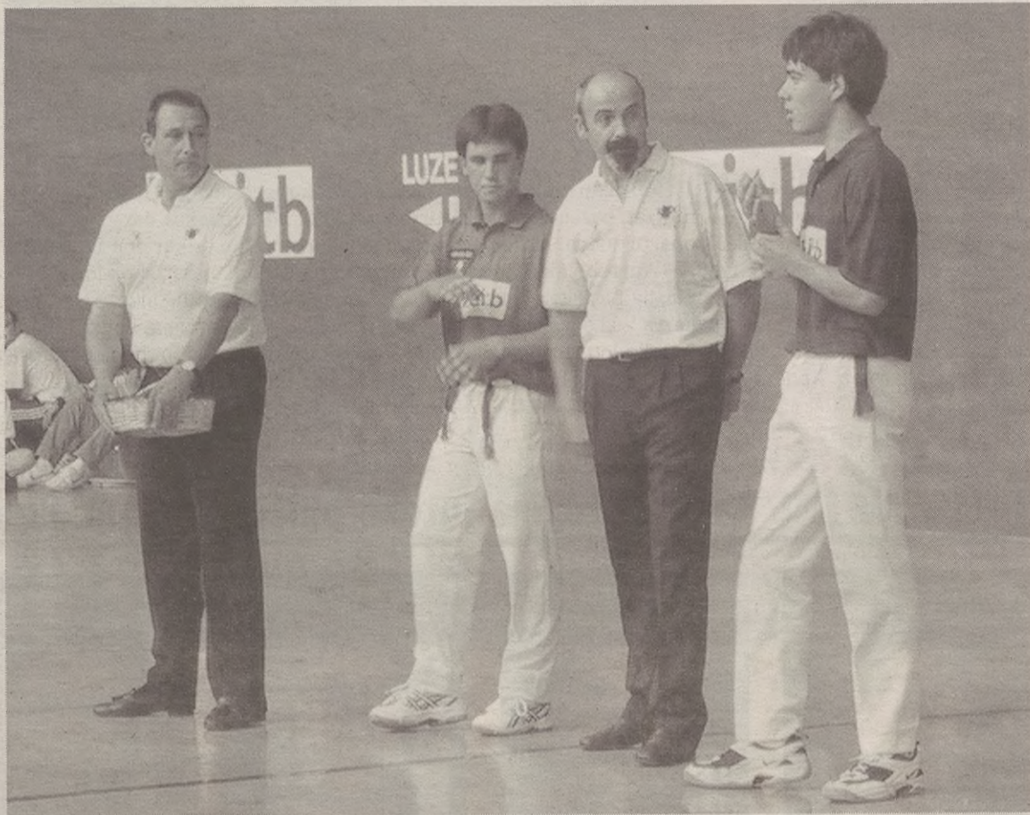
Hitzarmenaren arazoa konpondu eta gero, laster ekingo dio afaizionatu mailako lau t'erdiko txapelketak.

Astelehenean, txapelketarekin aurrera egitea erabaki zuten. Aurtengo txapelketa, ordea, desberdina izango da, ezingo dute eta nahi duten pilotari guztiek parte hartu. Guztira afizionatu eta gazte mailako 60 pilotari onenak gonbidatuko dituzte txapelketara. Afizionatu mailako txapelketa garrantzitsuenetako honekin laster hastera espero dute Ozkarbi Pilota Taldekoek.