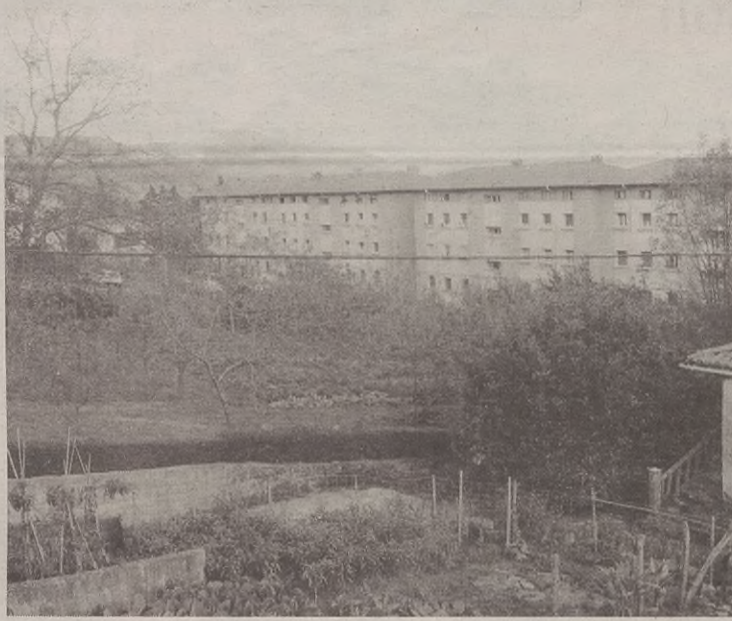
Elgetako Udalak espero du urte bukaeran hastea etxebizitzekin.

Datorren astean bertan etxebizitzetako inguruko batzarrean izan zirenei deituko diete, oraindik ere interesa duten jakiteko.