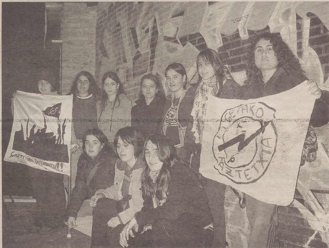
Honek neskok dauke gaztetiako batzarraren arduria, eta laster mutillak sartuko dirala esan doskue.

Helburu batzuk lortuta eukitziak helburu barrixak billatzia eragitten dau. Lehengo ibilbidia baloraziño baikorra egitten dogu, eta helburuak bardiña dira. Aldatu dana egoeria da. Lehenago gaztetiak era eta adin guztixetako jentiaendako ekintzak antolatu bihar zittuan.