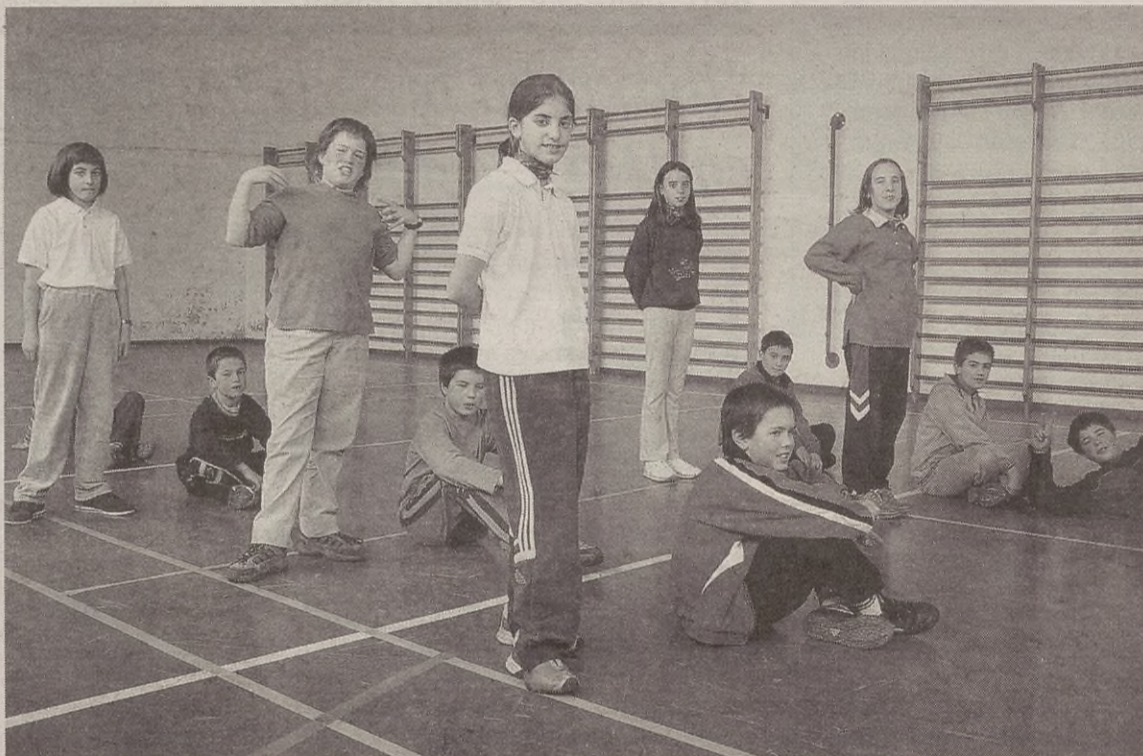
Datorren astean bertan hasiko da lehiakorrak ez diren kirolen programa.

Eskola Kirola Kontseiluak lehiakorrak ez diren kirolak egiteko aukerak eman nahi ditu. Parte hartu nahi duten umeek martxoaren 19a baino lehen eman beharko dute izena Kirol Zerbitzuetan edo Herri Eskolan. Jardueren prezioa 11 euro da.