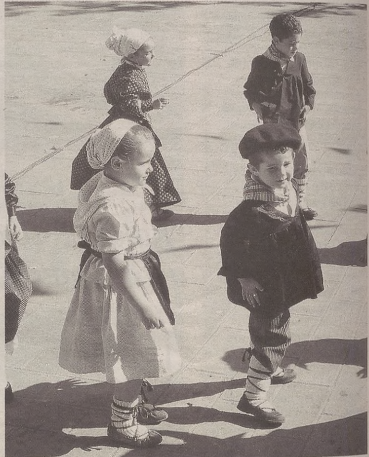
Haurrak bakarrik ez, nagusixak be baserittar jantziko die jaixetako eguenian.

dako arduradunei grabaziño bat emotia da asmua. Ereserki moldatu barrixa entzutiaz gain, izan leike danborradian ibillaldixa eta