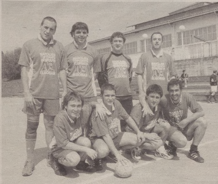
MTS taldekoek ezin izan zuten iazko txapeladunen aurka irabazi.

ASTERO PARTIDUEN ETA EMAITZEN BERRI GOIBEKOKALEk txapelketaren jarraipena egingo du. Barikuero zapatuan izango diren partiduen berri emango du. Partidu bakoi-tzean epaile lanak zein taldek egin behar duen ere aurreratuko dugu. Aurreko asteko emaitzak eta sailkapena zelan doan ere aurreratuko dizuegu.