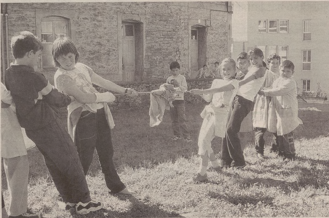
Debagoieneko Eskola Publikoen Tokapetan, herri kiroletan lehiatuko dira hainbat herritako neska-mutikoen.

Umeendako, zenbait jolasez osatutako zirkuitu bat gertatuko