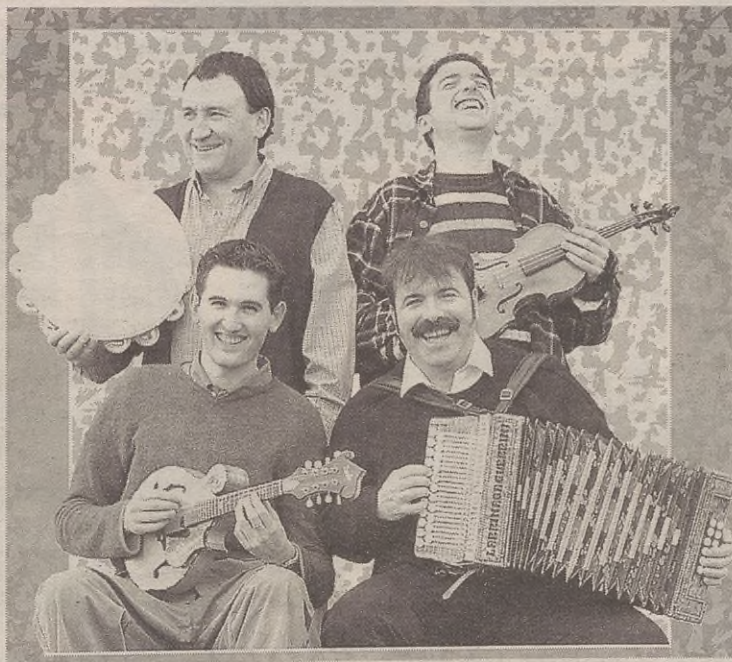
Tapia eta Leturiak alaituko du gaua Euskalkiaren Egunean.

Euskalkiaren Egunean, euskalkiaren gaineko zenbait hitzaldi eta liburu aurkezpen egiteko asmoa ere badago. Eta horrez gain, erakusketa ere jarriko dute, GOIBEKOKALEk zazpi urte hauetan ateratako erretratuekin eta egin duen ibilbidearekin.