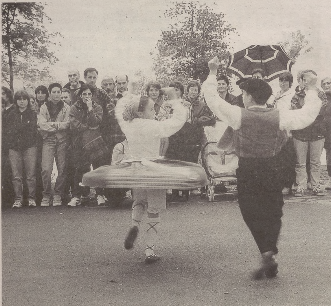
Mezaren ostian, Bergarako Moises Azpiazu dantza taldekuek erakustaldixa egingo dabe Asentzio Egunian.