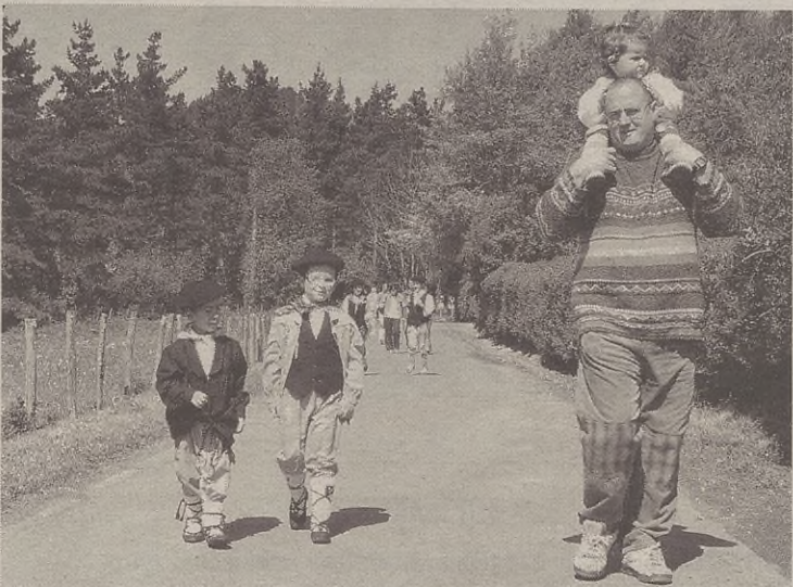
Giruak lagunduta, oiñez etorri ziran herritarrek eta kanpotarrek Aseztziora.