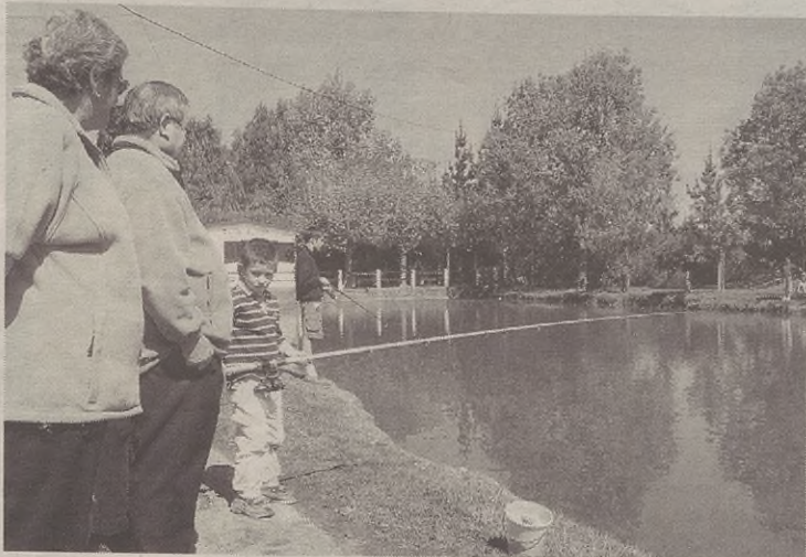
Arrantza Txapelketako parte hartzaileek ezin izan zeben arraiñik harrapau.

Eguerdirako eguzkixa zan nagusi Aseztzion, eta bazkaltzen bertan geratu ziranek berotu galanta hartu zeben. Bazkalostian dantzan eta kantuan egitten jardun zeben. Hola bukatu zan Aseztzio Eguna, herrixan izandako gertaerek eraginnda, iñoiz baiño tristiagua izan dana.