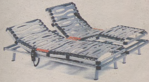
'Aluminium' ohe artikulatuak