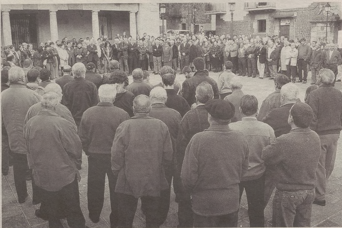
Gertatutakoa salatzen Udalak egindako deiarri erantzunez, jende ugari batu zen barikuan herriko plazan.

Lekukoek esan zigutenez, lau labankada jaso ondoren Arrate