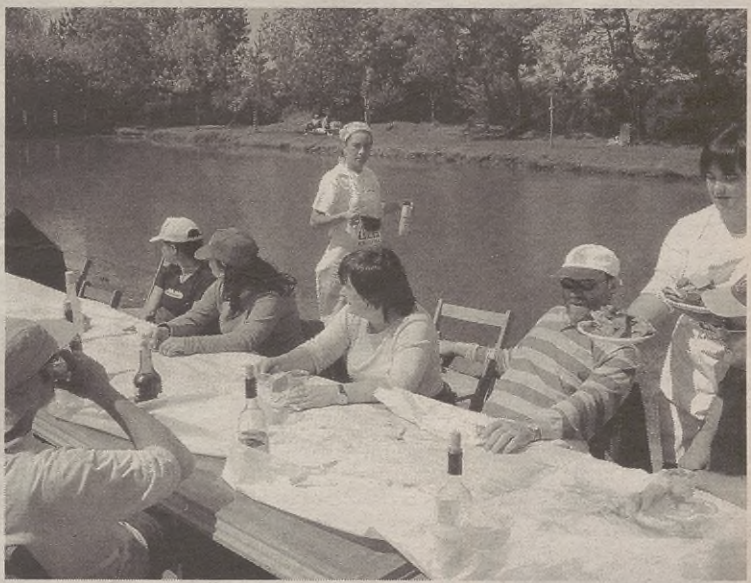
Bazkaltzera geratutakuek berotu galanta harrapau zeben eguzkopian.