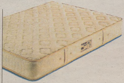
Era guztietako koltxoiak