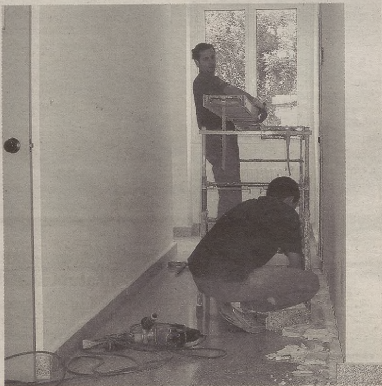
Eguazten goizean hasi ziren eskolako beheko solairuan konponketak egiten.

Jangela zenbat neska-mutikok erabiliko duten jakiteko, inkesta bat bete dute gurasoek. Inkesta horren emaitzetan argi eta gar-