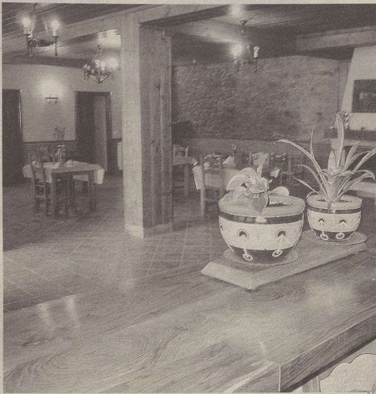
Beheko solairuan jangela, egongela eta sukaldea ditu baserri turismoak.

Barrenengoko baserri turismoan, gehienez, 18 lagunendako lekua dute. Hara inguratzen direnek izango dituzten beharretan ere ederto pentsatu dute. Beheko solairuan egongela handia dute, baita eguneko otorduak egiteko jangela ere. Kontuan izan behar