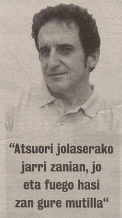
“Atsuori jolaserako jarri zanian, jo eta fuego hasi zan gure mutilla”

Hurrengo goizian, gure periodistiak hobeto ikusi zeban nun zeuan eta nor zeukan albu. Pentsau