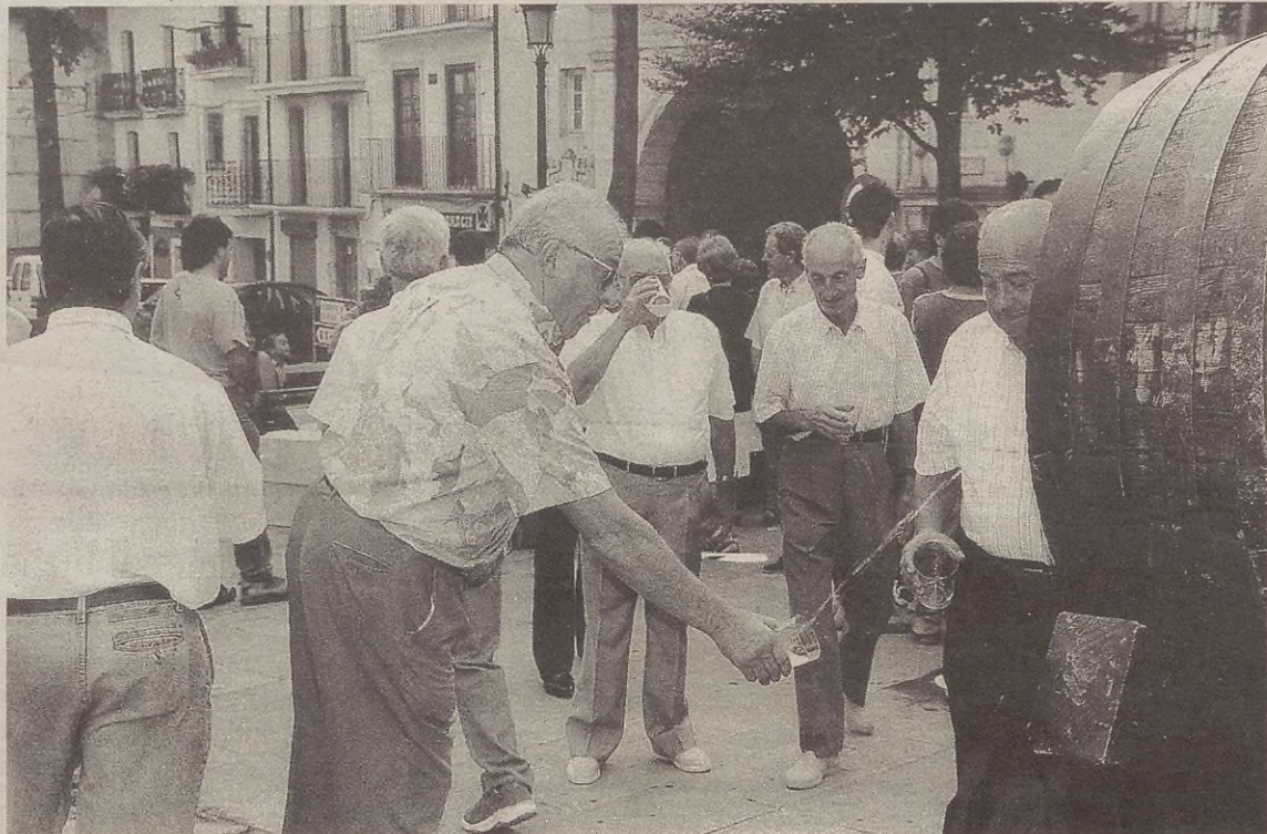
Aurreko urteetan moduan, herriko elkarte eta koadrila gehienak plazan elkartuko dira patata-tortillak egiteko.

Ordubetea patata-tortilla guztiak amaitu beharko dituzte. Tortilla guztiak sei arrautza izan beharko dituzte, gutxienez. Gainerako osagaiak sukaldariaren esku geratuko dira. 19:30ean, tortilla guztiak jasoko dituzte, eta epaileek denak dastatu bezain laster jakingo dugu aurtengo lehiaketaren irabazleak nortzuk diren. Tortilla onenaren sariaz gainera, tortilla originalena egi-