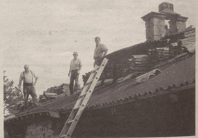
Hillia amaittu aurretik barrittuta geratuko da San Antonioko ermittia.

1699kuak dira horren ermittaorren lehen agirixak Elgetako udaletxian. Inguruko ermitta danak moduan, elizburua ekialdera begira dauka. Erretaulia biharrian margo barrokua dauka santuaren irudixakin; horrek marguok bertan mantenduko ditue.