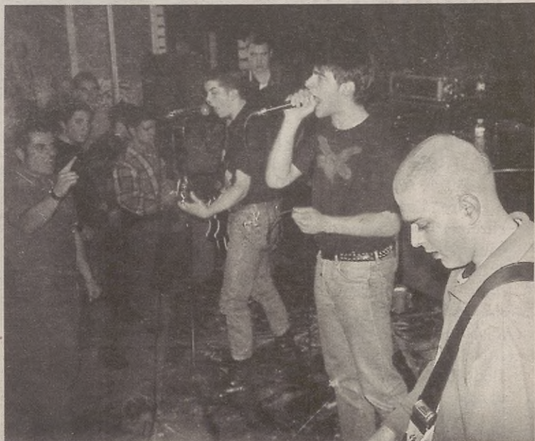
Aurrekuetan moduan, jentia dantzan eta saltoka ikusi nahi dabe Ostiada oi!-kuak.

Kontzertuakin batera Garagardo Festa be antolatu dabe gaztetxeuek. Atzerritik ekarritako garagardua edateko aukera izango da bertan. Gaur gabian festa girorik ez da falta izango geure herriko gaztetxean.