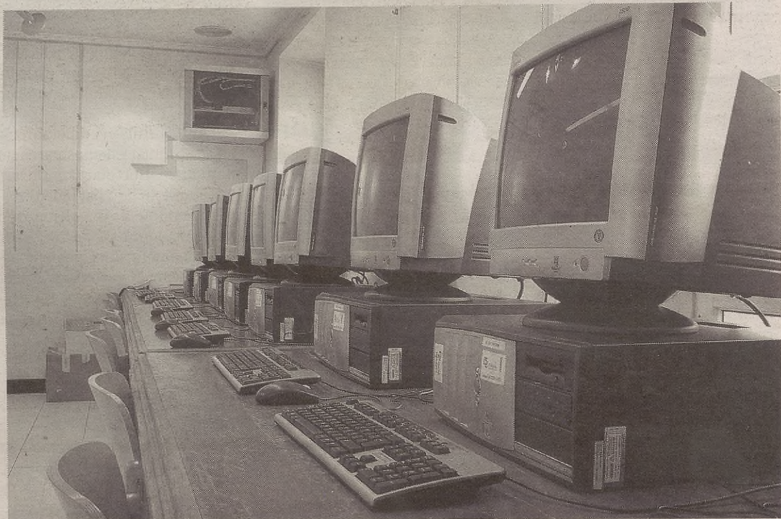
Bederatzi ordenagailu ekarri dituzte KZGunera, eta ikastaroak amaitzen direnean hiru geldituko dira bertan.

Astelehenean zabalduko ditu ateak KZGuneak. Azaroan goizetan egongo da zabalik. 09:00etatik 11:00etara ikastaroak emango dituzte eta 11:00etatik 13:00etara nabigatzeko egongo da zabalik. Ikastaroetan parte hartu nahi dutenek udaletxean edo KZGunean eman dezakete izena. KZGunean ematen diren zerbitzuak doakoak dira, bai ikastaroak baita nabigatzea ere. Abenduan arratsaldean egongo da zabalik.