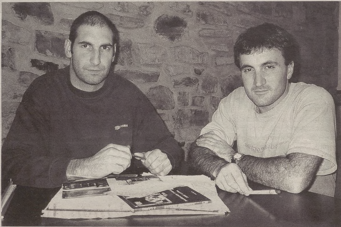
Gauzak aldatu ezean, Goibeko Kultura Elkarteko batzar orokorra deituko du talde eragileak, zer egin erabakitzeko.

Talde eragiletik idatzitako gutun bati Udalak erantzun ere ez ei dio egin: "Aspertuta gaude! Beti eutsi izan diogu elkarrizke-