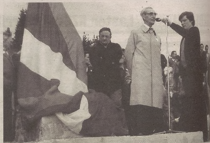
Erretratuan, 36ko gerran hildako gudarien oroimenez Elgetan egindako ekitaldia.

Laguntza eskatu gura duten elgetarrek Lurralde Ordezkaritzaren edo Udaleko Ongizate Zerbitzuetara jo behar dute. Elgetan ezin lehen eta eguen goizetan bertan ez dezakete laguntza eskatzeko eskaerak aurkeztu. Eta informazio zabalagoa nahi dutenek asteko bi egun horietan jo dezakete udaletxera. Otsailaren 28an amaituko da laguntzak eskatzeko epea.