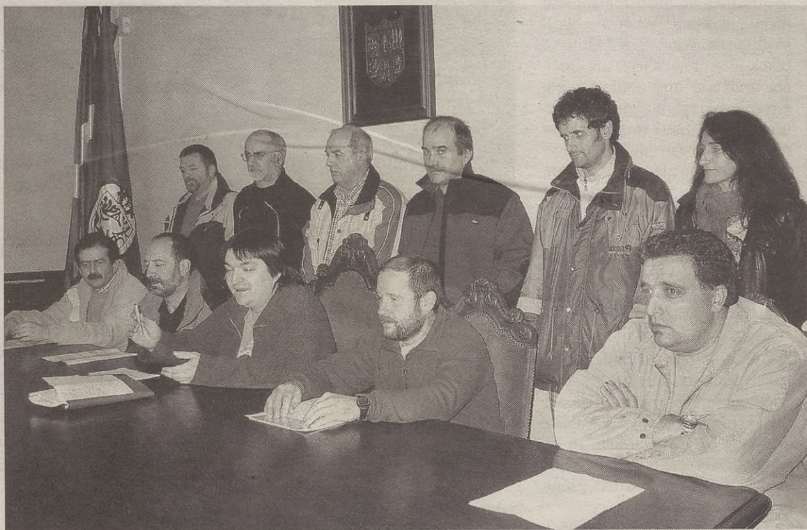
Bost legealditan ezker abertzaleak izan dituen zinegotziek eta Talde Independenteko zinegotzi batzuek sinatu dute.

KOORDINATZAILEA: Oxel Erostarbe • Barrenkalea 33 20570 BERGARA • Tel.: 943 76 92 71 • Faxa: 943 76 29 77 • Posta elektronikoa: goibekokale@goiena.com • Lege gordailua: SS475/95