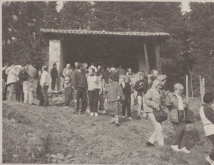
Elgetar ugari gerturatu ohi da egun horretan Arantzeta auzora.

Herriko Ferixa Nagusixaz gain, auzoetako jaiez ere arduratzen da Jai batzardea. Azken asteotan, uztailearen 3tik 6ra artean izango diren jaien egitaraua antolatzen dihardute buru-belarri. Jai batzordearen hurrengo batzarra datorren eguaztenean izango da, hilaren 12an. Batzar horretara gonbidatuta daude aurtengo jaientarako proposamenak egin nahi dituzten herritarrek.