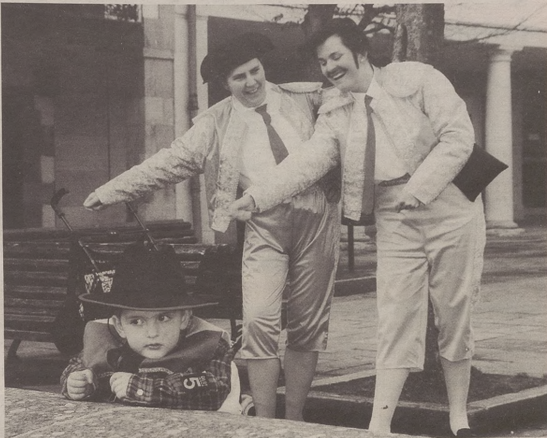
Askotariko mozorroak ikusteko aukera izan dugu aurtengo Iñauterixetan; hurrengo mozorro eguna jaietan izango da.

Giro aparta izan zan aurreko barikuan, Iñauterixak zirala-eta. Danerako mozorruak ikusteko aukeria izan giñuan: fuel-olixua jasotzen jardun zebe bi lagun, labadorak, sorgiñak, torerak, Gabonetako arbolak, infernuko aingeruak, futbol amerikarreko jokalarixak, Egunkaria -n zaliak... Arratsaldian hasi ziran Iñauterixak gure herrixan. Eskolan jolasak izan ziran umiendako, eta gero, gurasuak gertautako txokolatadia izan zebe Ozkarbi elkartian. Eguna illundu ahala, umiak etxeruntza eta nagusixaguak hartu zittuen kaliak. Illuntzerako baztarrak nahasten hasi ziran. Etxafleruen zaratiak lo egittia eragotzi zotzen etxian geratu ziranei; kalian, barriz, jai-xa nagusi. Gaztetxian dantza egin ostian, plazan batu ziran mozorrotutakuak. Zezenetan egin ostian, mozorrotuta zeren tabernetara... Urtero moduan, goizeko argixakin topo egin zebe batek baiño gehixagok. Originalenak hasi dira Ferixa Nagusixetarako mozorruak gertatzen.