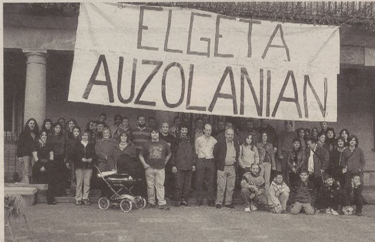
Aurkezpeneren ostean, erretratua atera zuten Elgeta Auzolanian Bilguneok.

Elgeta Auzolanian Bilguneak bihar, zapatua, egingo du lehengo batzarra. Udaletxean izango da, 16:00etan. Plataforma zelan egituratu eta zelan antolatu erabakiko dute. Eta helburu zehatzak markatuko dituzte.