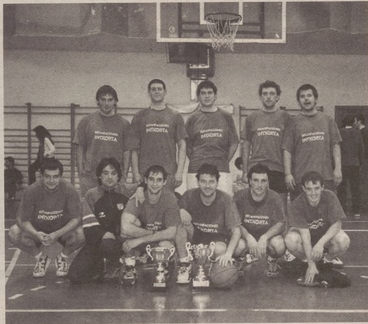
Aurtan ere Kopa irabaztea dute helburua Estampaciones Intxortako mutilek.

ASTE BUKAERAN HASIKO DA KOPA Domekan, 16:30ean, Eibarko Celtics taldearen aurka jokatuko dute Estampaciones Intxortako mutilek. Iaz moduan, aurtan ere Kopa irabaztea dute helburu.