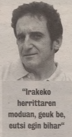
"Irakeko herritarren moduan, geuk be, eutsi egin bihar"

Irakeko gerria dala eta, hor ikusi dittugu azkenian gorrixak ei ziranak manifestaziñuan, barriri euren "pueblo soberanua" osatuz. Horrek ilusiñua eman dosku. Igual, hemendik aurrera, behin gorritzen hasitta, ziharo gorrittu eta barriri federalismua eta autodeterminaziñua eta holakouekin hasiko jakuz.