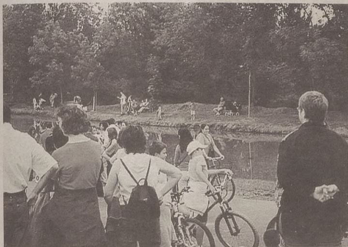
Asentzioko putzuaren inguruan bizikleta lasterketa egin zuten herriko umek.

Asentzio Eguneko jaia, hortaz, herrian amaitu zuten elgetarrek. Bolo jokoa antolatu zuten, eta trikiti doinuekin txikiteoa egin zuten herriko tabernetan.