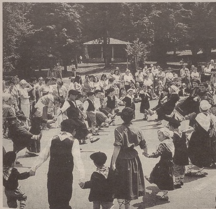
Dantzarik ez zen falta izan Asentzio Eguneko jaietan.