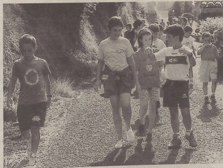
Aisialdi taldean 3 eta 6 urte bitarteko 12 ume izango dira.

Bestalde, aerobika egiteko 20 lagunek eman dute izena, eta bi taldetan jardungo dute kiroldegiko gimnasioan: hain zuzen ere, txikien eguztinetan eta eguztinetan 18:00etatik 19:00etara izango dute ikastaroa eta gazteek eta