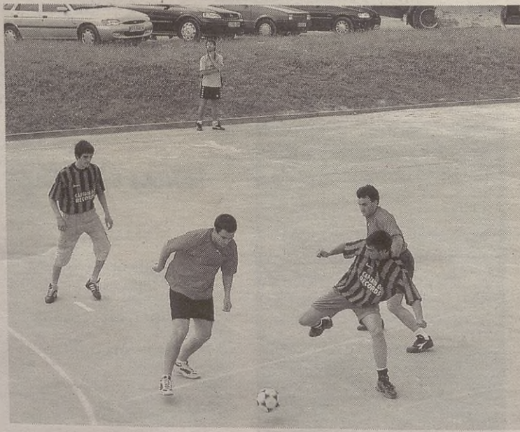
Elgetako Txapela eta La Kokotxa taldeek hartu dute parte txapelketan.

Elgetako jaietan, uztailaren 5ean (zapatua), jokatuko da finala, arratsaldeko lauretan. Gero, sari banaketa egingo dute.