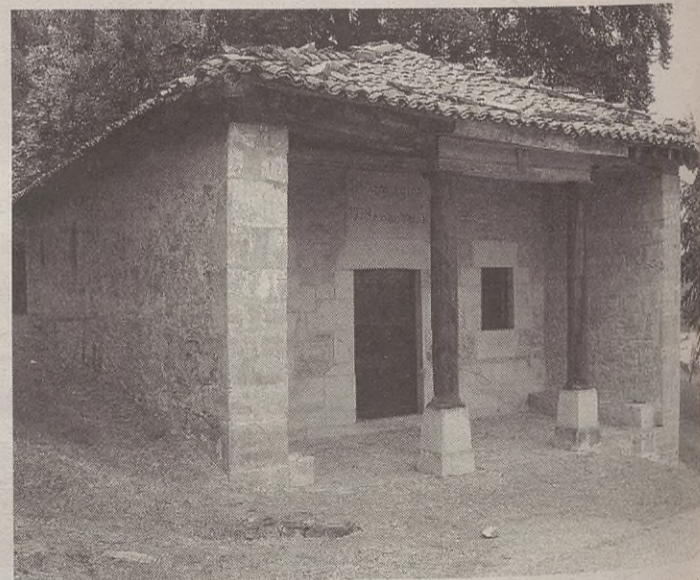
Salbador ermitan meza izango da abuztuaren 6an jaiak ospatzeko.

Iluntzean, auzoko plazan berakatz-zopa janez jaiak hasi eta gero erromeria izango da goizalderarte. Santiago egunez, egubakoitzean, berriz, meza, herri kirolak, bertsolariak, dantza solte erakustaldia, bolo jokoa eta erromeria daude antolatuta auzoko jaiak girotzeko.