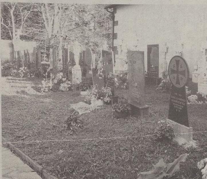
Hilerriko ekialdeko hormaren eta pasabidearen arteko lursaila egokituko dute.

Lanak aurki hasiko dituztenez interesatuek lehenbailehen jo behar dute udaletxera.