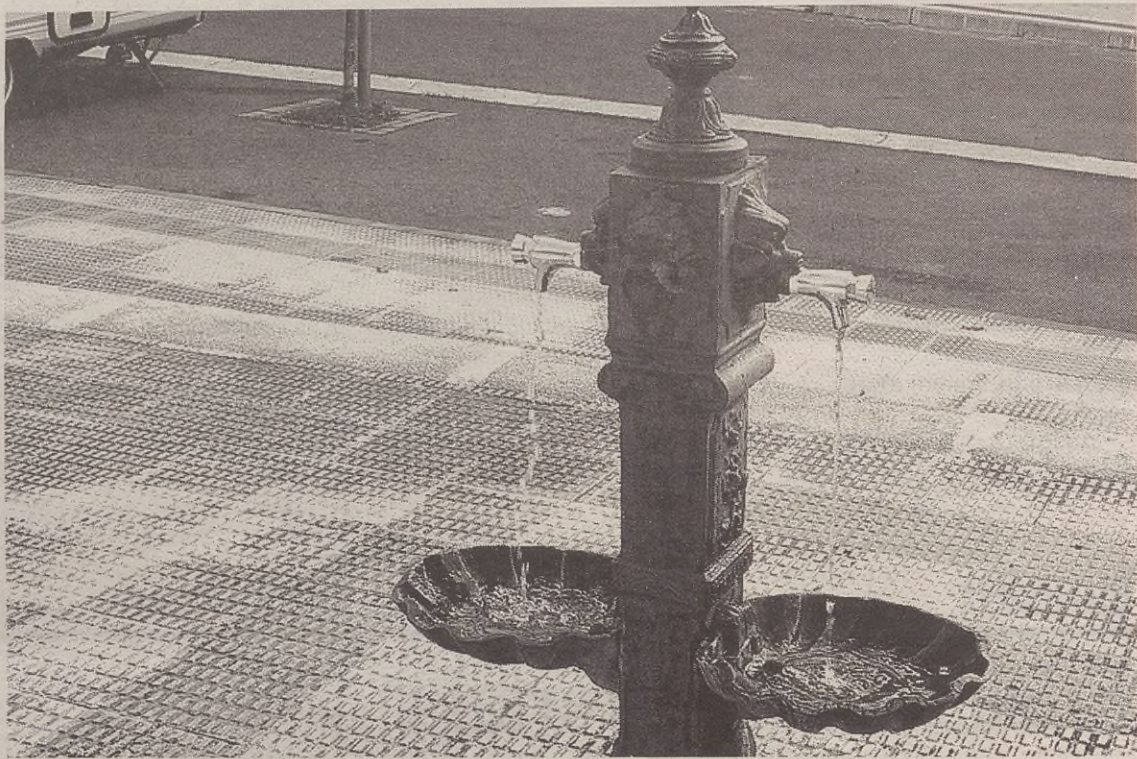
Gipuzkoako Ur Partzuegoak eta Udalak egindako akordioak 10 urte iraungo du.

Ura herriko etxebizitza guztietara eramatea, kaleetan zehar doan uraren sarea egoki edukitzea eta konponketak egitea izan dira orain artean Partzuegoaren zereginak. Baita matxuren kasuan 24 orduko zerbitzua eskaintzea, ur kontagailuen irakurketa eta honekin lotutako lan administratiboa egitea ere. Aurrerantzean, ur zerbitzuarekin lotu-