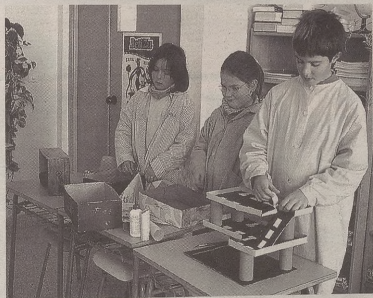
Eskolako umeez jolasak egiten dihardute, materiala birziklatuta.