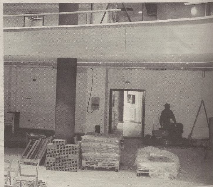
Hilaren 7an hasi zituzten Espaloia aretoa egokitze lanak.

Bestalde, jadanik ezarri dituzte Kafe Antzokia ustiatzeko baldintzak, eta aurki buletinaz azalduko dira.