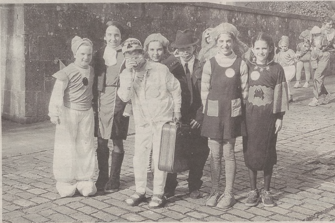
Escolako umeak Inauteri-bariku goizean aterako dira kalera mozorrotuta.

Herritar guztiek parte hartu ahal izango duten ikastaro horretan, besteak beste, Lantzeko zortzikoa, txantxo eta polka dantzak