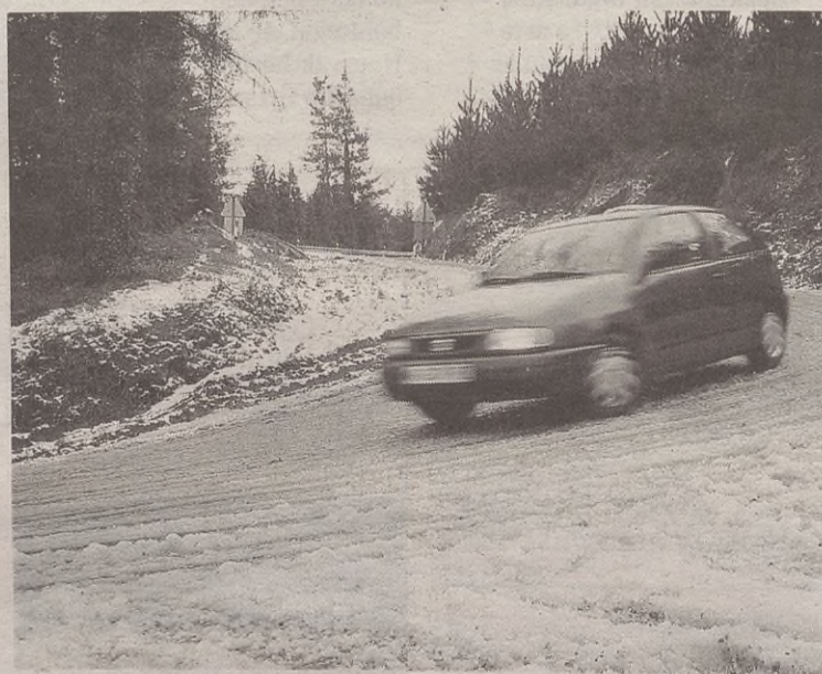
Elurteak iragarritan daudenean, telefonoz eta Internetez emango dute informazioa.

Horretarako, udaletxeko telefonora deitu beharko da: 943 76 80 22. Internet bidez ere jaso ahal izango da errepideen egoeraren berri, Elgetako Udaleko webgunean: www.elgeta.org .