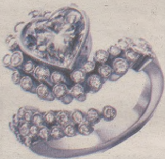
Emakumezkoendako eraztuna Etxeberria bitxitegia Bidekurutzeta 16