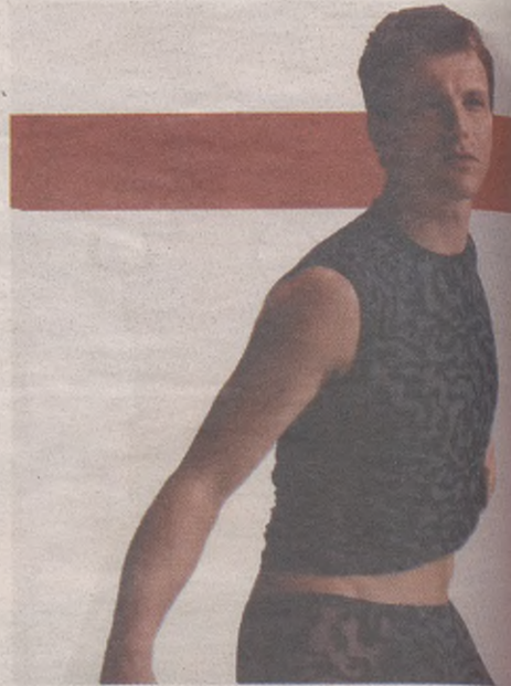
Mutlendako barruko arropa Gantxegi mertzeria Telesforo Aranzadi 2