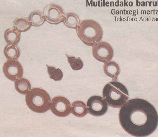
Lepokoa eta belarritakoak Haraia zilarrezko bitxiak Boni Laskurain 4