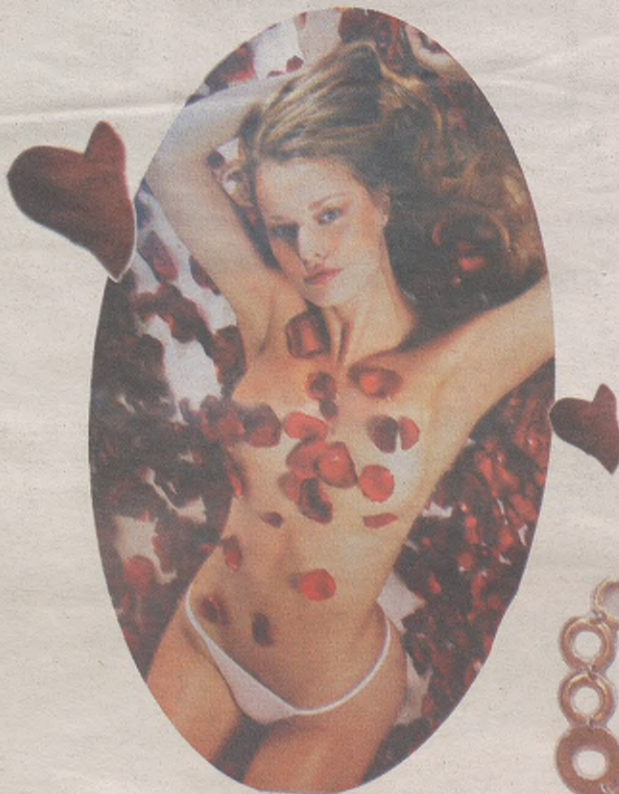
Emakumezkoendako lentzeria Igarza mertzeria Irala 5