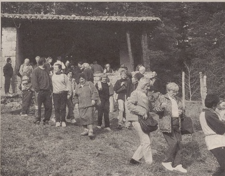
San Blas ermitan opilak eta gozokiak bedeinkatzeko meza izango da.

Antzina San Blas eguneko ospakizunetan iluntzean erromeria izaten bazen ere, orain ez da egiten. Aurten, trikitilaririk izango den ere zehazteke dago.