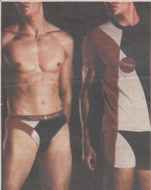
Gizonezkoendako barruko arropa Gallastegi konfekzioak San Pedro 15