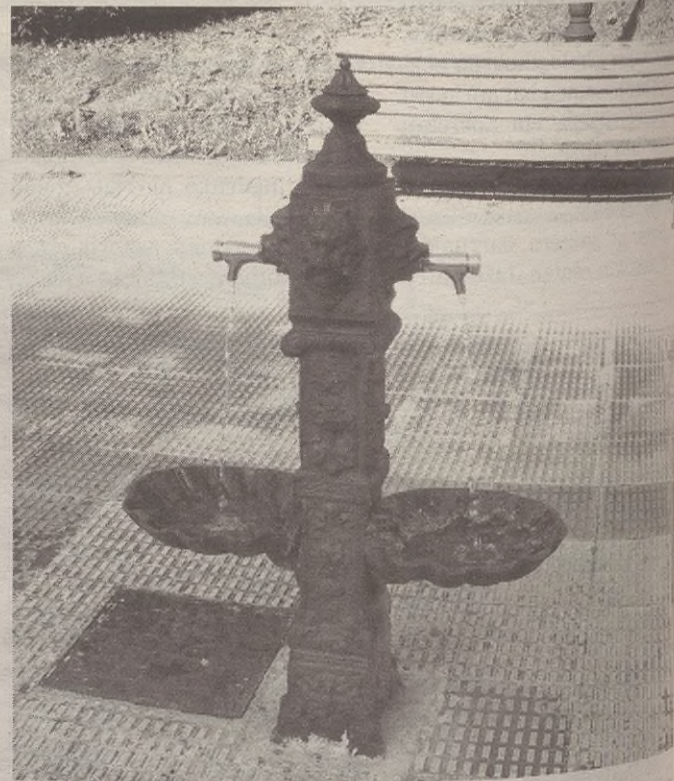
Herri inguruko iturri gehienak ur sare publikoari lotuta daude.

Herri inguruan dauden iturri gehienek edateko ur ona ematen duten arren, badira beste batzuk zalantza sor dezaketenak. Izan ere, Lehenengo Errekan dagoen iturrira ur bila joateko ohitura dute elgetar askok. Baina bertako iturri hori ez dago sare publikoari lotuta; horrenbestez, ez da erabat ziurra bertako ura edateko ona den edo ez.