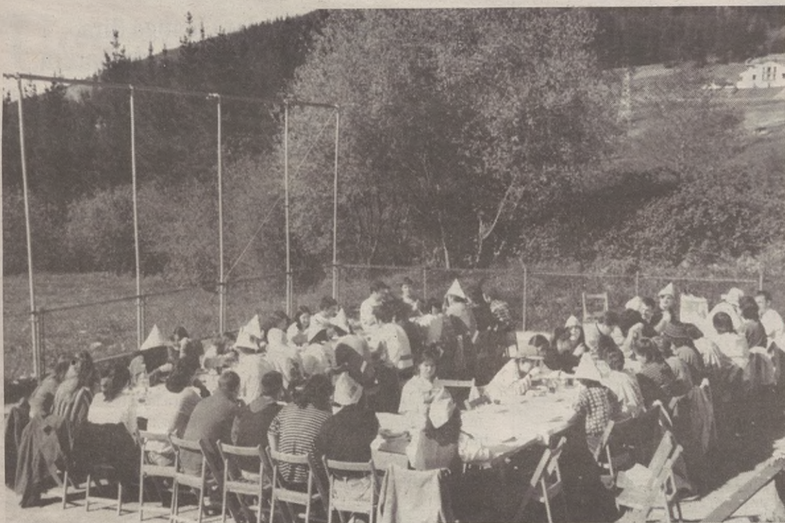
Martxoaren 20an, goizean trikitilariak izango dira eta bazkariaren ondoren bertsolariak eta baita ezustekoa ere.