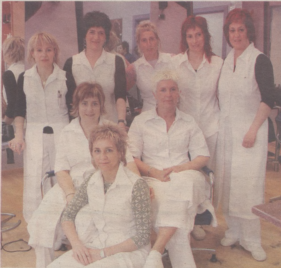
Disdira ile apaindegiko lan taldea

Bai, jendea ausarta da. Orain orrazkera desberdin asko dago. Lanean hasi nintzenean hiru orrazkera zeuden bakarrik eta jende guztiak ilea berdin eramaten zuen; orain, berriz, bakoitzaren estiloaren arabera mozten da ilea. Koloreak ere garrantzi handia dauka gaur egun, gure ile apaindegian gehien egiten duguna kolorea da.