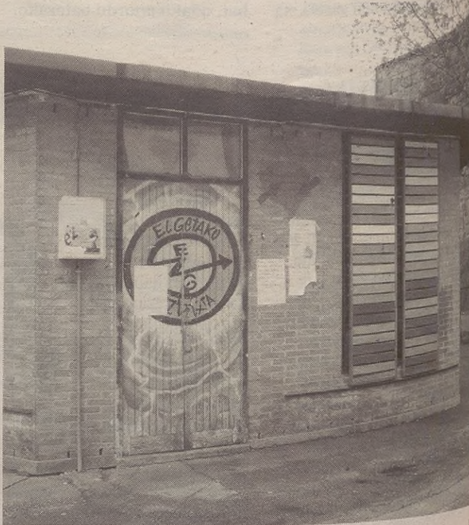
Azken bi aldietan gaztetxeko ate nagusitik sartu dira lapurrak.

Gaur, barikua, maiatzak 7 bideo emanaldia eta kafe tertulia izango dira gaztetxean bertan arratsaldeko 18:00etan hasita.