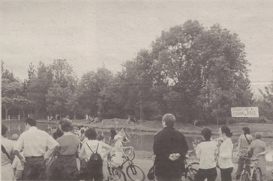
Mezaren ostean herriko dantzariak erakustaldia eskainiko dute Asentzión.

Dantzak ikusi ondoren herri kirolen txanda etorriko da. Herriko hainbat koadrilak hartuko dute parte herri kirolen txapelketan. Koadriletako neska-mutilek artoa jasotzen, sokatiran eta zaku karretan jardun beharko dute nor baino nor gehiago. Orain dela zenbait urte egin ziren antzerako probak Asentzio Egunean, eta