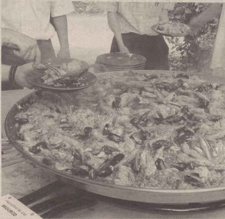
Plazan egingo duten paella jaietako zapatuan banatuko dute.

Bazkalosterako ere prestatua dute ekitaldirik. Herriko koardilen arteko jokoak izango dira plazan bertan, eta herritarrak bazkarian eta jokoetan parte hartzera animatu nahi dituzte.