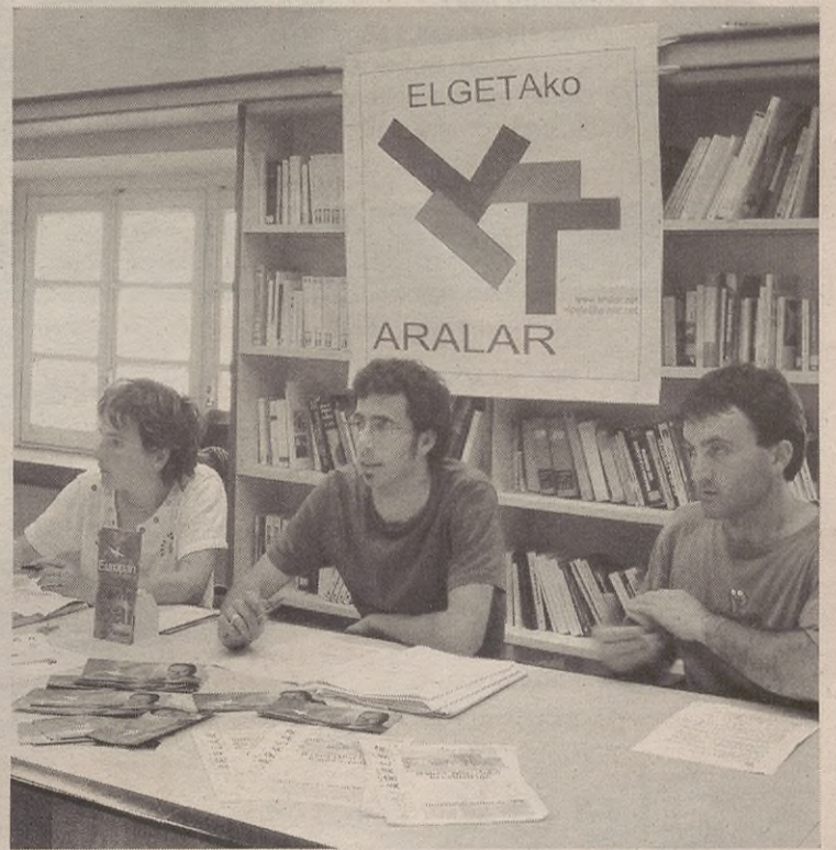
Aralar alderdiak Udalean dituen hiru zinegotziek eman zituzten azalpenak.

Horretarako herritarren partaidetza bultzatzea, Udala herriarengana gerturatzea, haren barne funtzionamendua hobetzea eta Udalean zabaldu duten aro berria etorkizunean sendotzea dira datozen urteetarako Aralarrek dituen erronkak.