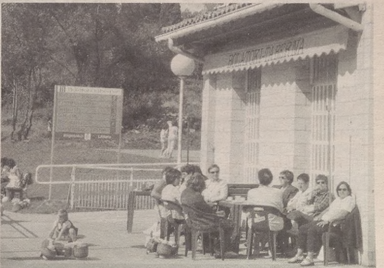
Egungo tabernako arduradunek ia bi urte eman dituzte bertan lanean.

Informazio gehiago nahi duenak edo interesatuak udaletxera jo beharko du eta ondoren eskaria aurkeztu.