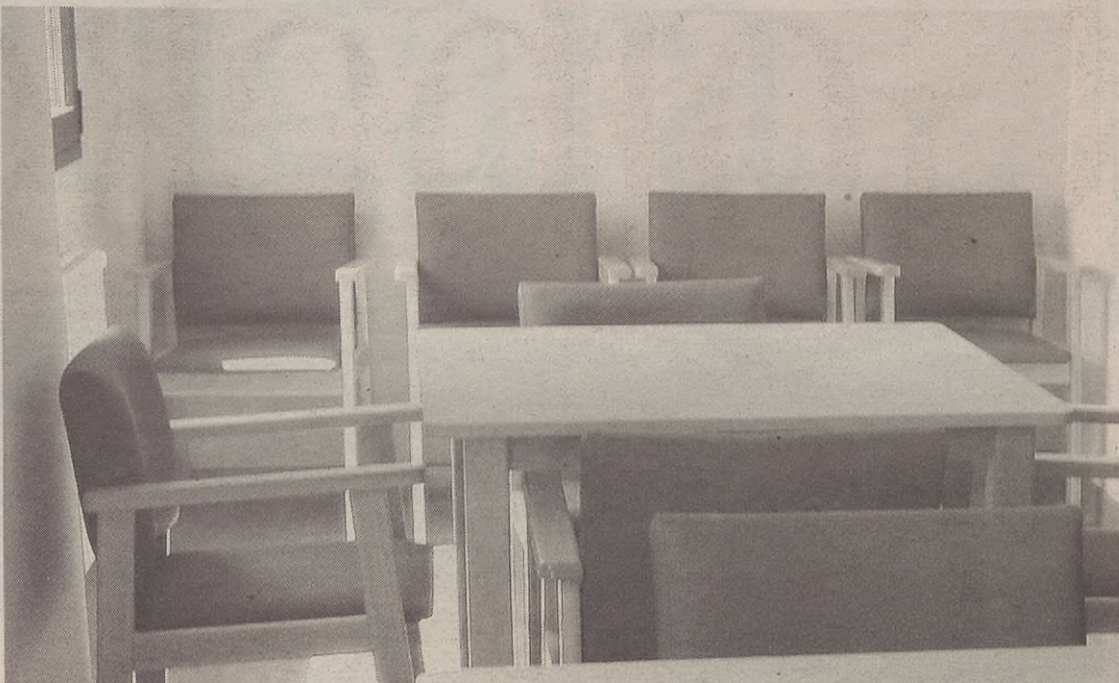
Eguneko zentroa beheko solairuan egongo da eta, besteak beste, hainbat mahai eta aulki ipini dituzte bertan.

Baina aurrez egongo da zentroa ezagutzeko aukerarik. Domekan, uztailaren 18an, atak zabalik egongo dira herritarrendako 11.00etatik 13:00etara eta 18:00etatik 20:00etara bitartean.