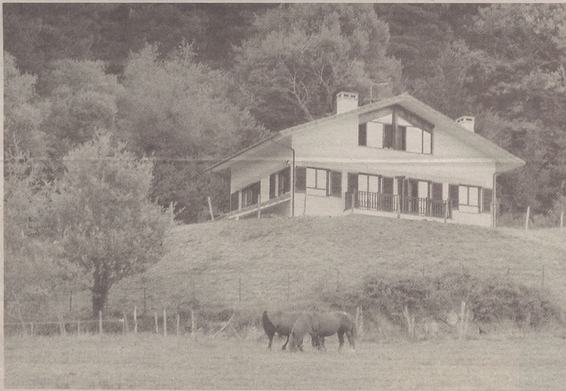
Eguzkitza (argazkian) eta Barrenengua, herrian dauden baserri turismoko bi etxeak beteta egon dira abuztuan.

Baserri turismoko bi etxe daude Elgetan: Barrenengua eta Eguz-