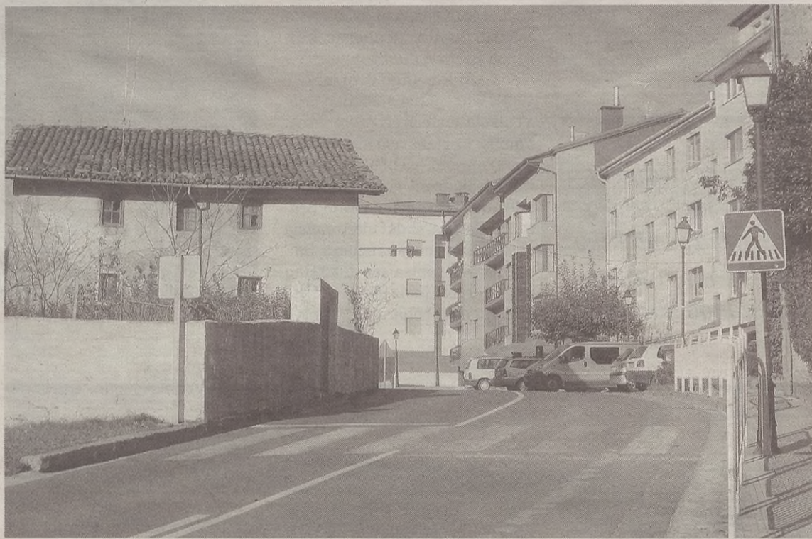
Artekaletik Eibarrerantzako bidean hiru irlatxo ipiniko dituzte eta hauetako batean baita semaforoa ere.

Bigarrena Artekaleko azken etxeetatik gutxi gorabehera 40 metrora egingo dute. Horrela, Eibartik datozen autoek abiadura moteldu beharko dute.