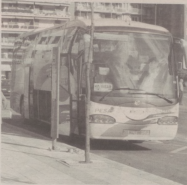
Pesa autobus konpainiak egiten du Elgeta eta Bergara arteko ibilbidea.

Ordu horietan jende asko ibili bada ere, beste batzuetan oso urria izan da erabilera. Goizerdian Bergararik Elgetara ez da inor joan autobusez hilabete guztian, eta Elgetatik Bergarara ere bost baino ez.