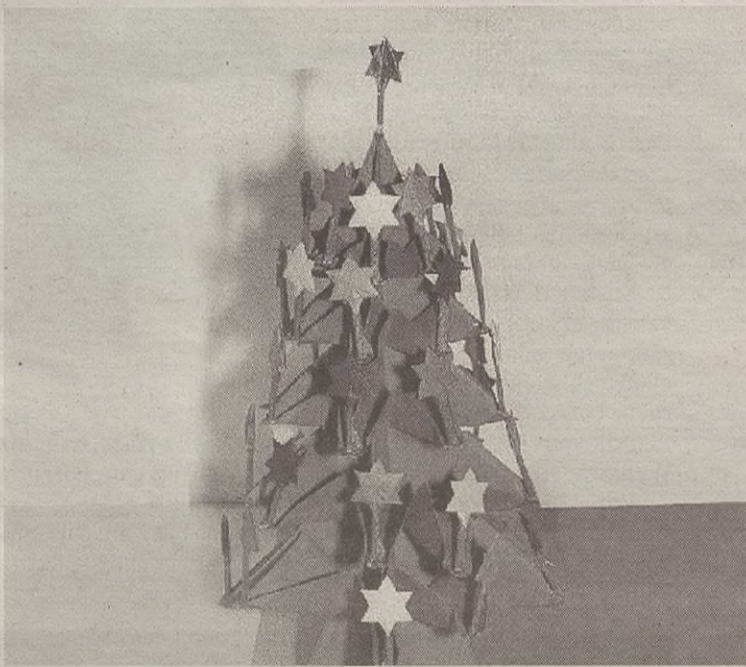
Gabonetako zuhaitzen lehiaketan edozein tamainatako zuhaitzak aurkez daitezke.

Irakasleek azokarako materiala jasoko dute azaroaren 15etik 26ra bitartean, eta sailkatu ostean, ikasleek materialari prezioa jarriko diote. Ikasleek eurek antolatuko dituzte egunean bertan azokako postuak eta eurek egingo dituzte saltzaile lanak.