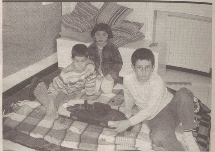
Astlehenean zabaldu zuten, eta jadanik 12 ume eman dute izena.