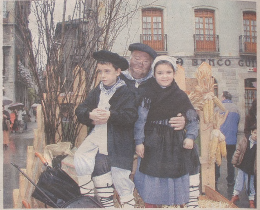
ABENDUAREN 24AN, 11:00ETAN ESKOLAN ELKARTUKO GARA HERRITIK ZEHar GABON KANTAK ABESTEKO