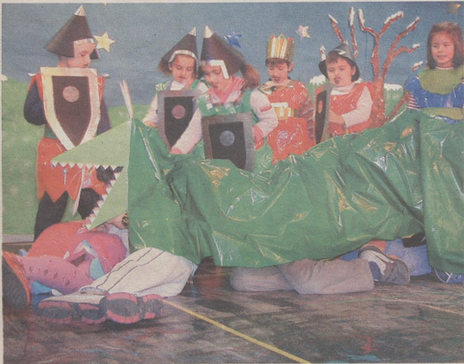
HAUR HEZKUNTZAKO GABONETAKO JAIALDIA ABENDUAREN 22AN, ARRATSALDEKO 15:15EAN ESKOLAKO ARETOAN.