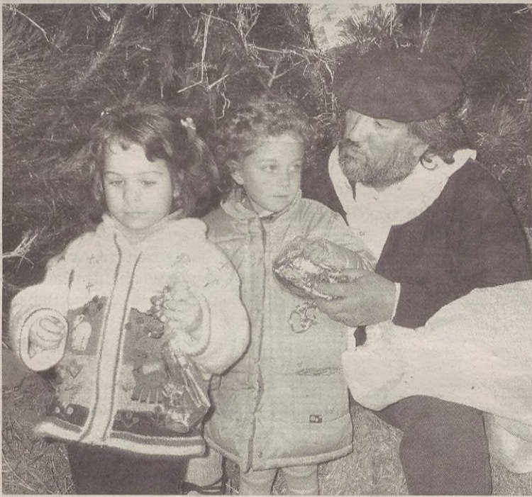
Olentzero abenduaren 23an etorriko da umeen eskutitzak jasotzera.

Eskolako umeek ere Gabonak direla-eta egingo dituzte hainbat