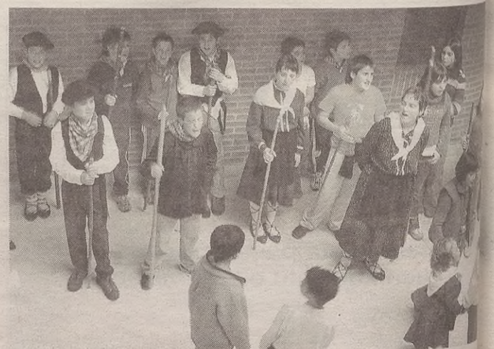
Eskolako umeak Santa Ageda eskean irtengo dira goizez eta mozorrotuta gero.

Oñatiko Oinatz dantza taldeak kalejira egingo du 20:00etan. Gero Luzaide dantza plazan, herriko gazteak dantza saioa egingo dute. Eguraldi txarra eginez gero, Espalioan izango da.