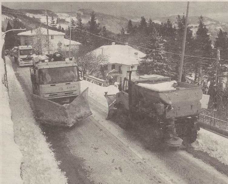
Egunotako elurtea dela eta, abian ipini du Udalak protokoloa.

Udalak elurra kentzeko makina dauka eta herritar baten laguntza ere izaten du beste makina batekin. Horrez gain, errepide nagusiak Foru Aldundiko makinak garbitu dituzte.