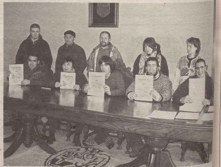
Eragileek eskatu dute Europako Itunaren erreferendumean ezezko botoa emateko

Bestalde, martitzenean osoko bilkura egin zuten udaletxean, eta konstituzioari ezezkoa emateko erabaki zuten. Aralarko hiru zinegotziek eta EAko Inaki Ugarte buruk egin zuten ezezkoaren alde eta gainontzekoek aurka.