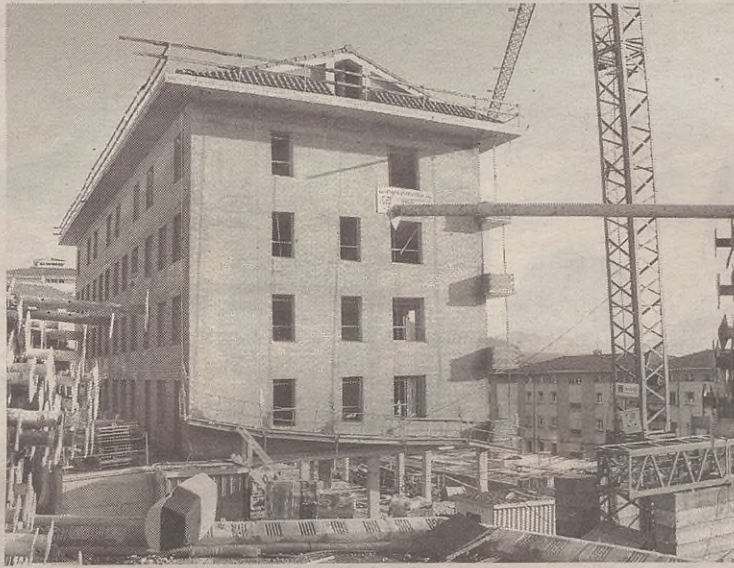
Torrealdean etxebizitza libreak egiten dihardute; babes ofizialekoak ere egingo dituzte.

Aralarrekin esan du babes ofizialeko etxebizitzak alde egingo dutela beti. Aralarrekin esane-tan, “batzar publikoa egin behar da lehenbailehen, etxebizitza horien zozketan parte hartzeko baldintzak azalduz eta izena emateko zerrendak zabalduz.