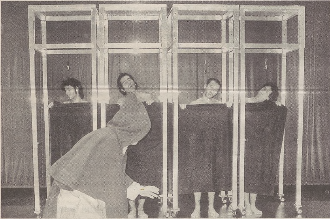
El Decameron antzerki lana egingo du gaur gauean Ados Teatroa konpainiak Espaloian.