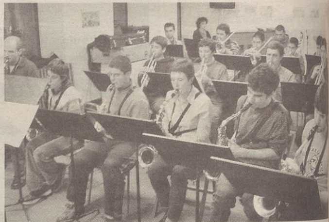
Arrasate Musikaleko Big Banda eskolako 20 musikarik osatzen dute.

Bergaran izandako arrasatearren ostean Elgetan ere martxoaren 31n berean jardutea da euren asmoa.